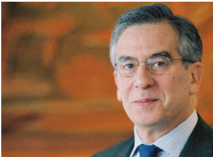
Eneko Landaburu, Director General de Relaciones Exteriores de la Comisión Europea

No es posible profundizar en el proceso de integración europeo hacia una Europa política siguiendo los pasos del miembro menos ambicioso de la familia. El mundo necesita una Europa integrada, fuerte y sólida. No comparten todos nuestros Estados el mismo nivel de ambición para ello. Así que no existe otra alternativa que la de profundizar con el grupo de los que quieren, permitiendo reengancharse, en el futuro, a los Estados miembros no partícipes de ese proceso. De esta forma se ha creado el Espacio Schengen de libre circulación de personas. De esta forma también se ha creado el Euro. No veo otra alternativa a ese método para avanzar.