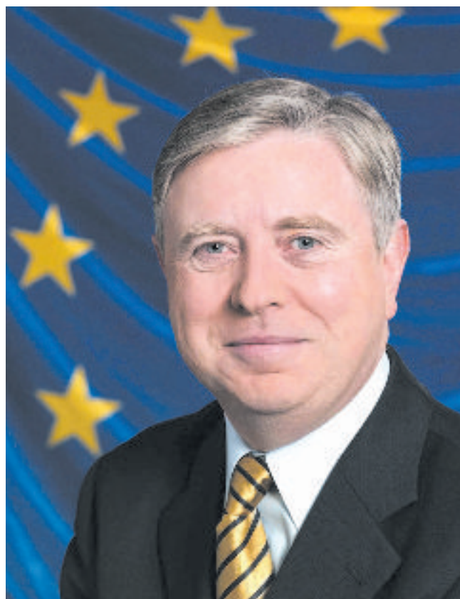
Pat Cox, Presidente del Movimiento Europeo Internacional (MEI).

Tras los dos conocidos rechazos al Tratado Constitucional del pasado año en Francia y Holanda, el “período de reflexión” posterior anunciado por el Consejo Europeo arrancó con el sonido del silencio. El año 2006 ofrece perspectivas de un nuevo comienzo. Necesitamos debate y es preciso que sea amplio y europeo, y no únicamente con perspectiva nacional y limitada. Por otra parte, necesitamos también un liderazgo político. El Parlamento Europeo ha fijado sus preferencias para el diálogo y la toma de decisiones, y los líderes políticos nacionales más destacados han empezado a dejar oír sus voces de nuevo. El debate sobre lo que hay que hacer a continuación se está celebrando ahora. No está aún definido, pero ya está tomando forma. Es evidente que los calendarios electorales influirán en su ritmo y en su forma. Necesitamos tiempo. El Movimiento Europeo continúa creyendo