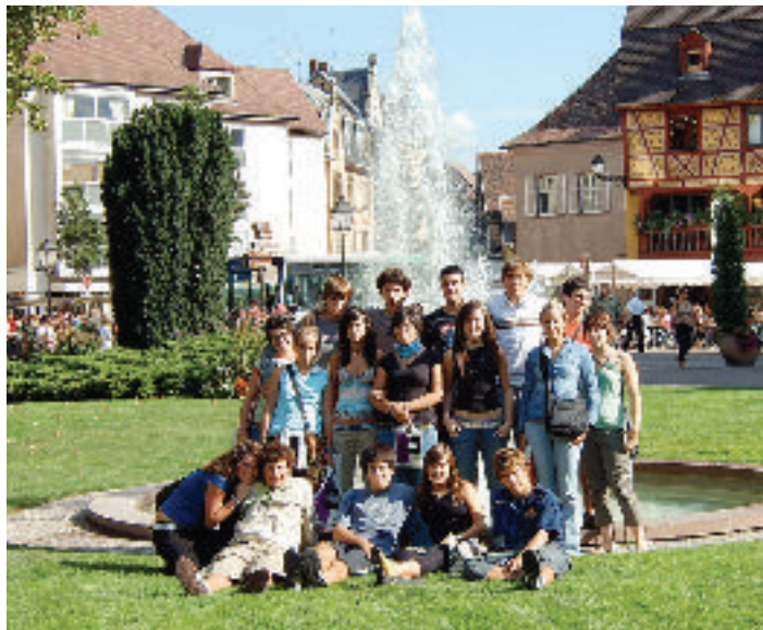
Bidaia oso aberasgarria iruditu zitzaien

Berriz egunerokora itzuli ondoren egiten dugun balorazioa honakoa da: bidaia oso aberasgarria iruditu zaigu bere orokortasunean. Asko ibili gara, asko entzun dugu, asko ikusi dugu, gure arteko harremanak estutu dira, ezezagunari zaion beldurra uxatu dugu eta lehen genuen heldutasunari bere osotasunera iristeko laguntza eskaini dio bidaia honek; "ezberdina"-k ez du esan nahi hobe ala okerragoa, graduaziorik ez duen marko batean dago. Konparazioak alde batera uzten ikasi dugu, pertsonak, gauzak eta kulturak bere horretan aztertu behar direla ikasi dugu, eta ez gurearekin konparatuz. Eta hori horrela, gozatu dugu guztiok, bai guk haiek ikusiz eta aztertuz eta bai haiek beraien bizimodua lasai eta mespretxurik gabe eginez. Hau esatea erraza da, baina jakiteko bizi egin behar da. Beraz, bihotzez esaten dizuegu, ahal izanez gero, teoriak alde batera lagata, munduaren liburitik ikasteko, merezi du eta.