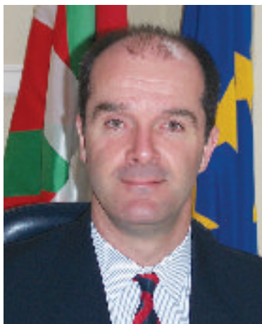
Delegado de Euskadi en Bruselas

Confirmando con orgullo que tras 20 años de seriedad, eficacia y trabajo bien hecho la Delegación de Euskadi es apreciada en las instituciones y áreas en los que trabaja. La UE tiende a un reconocimiento práctico de la “región” como unidad territorio-social básica que mejor representa a sus ciudadanos; esto refuerza la apuesta por una Delegación de Euskadi activa y eficaz que no olvida que la UE, como supragobierno europeo, seguirá decidiendo gran proporción de materias de aplicación directa en Euskadi.