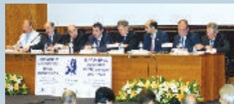
EUROPAN ERATUKO DEN UNIBERTSITATE ESPAZIOA EUSKADITIK IKUSITA

Munduak Europa integratua, indartsua eta sendoa behar du