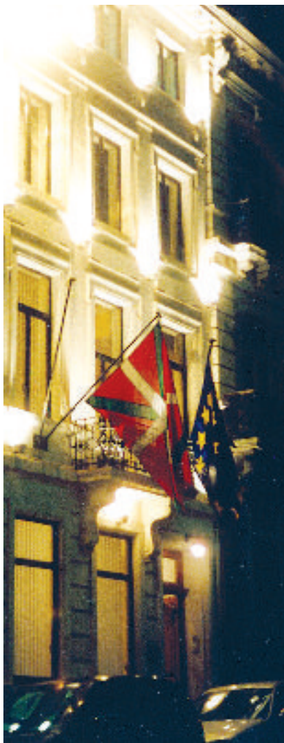
Delegación de Euskadi en Bruselas

Muchos Estados han peleado la rúbrica de cohesión, aunque también esta última ha sufrido recortes en relación con la propuesta de la Comisión, de