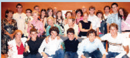
II. CIVIS SARIAREN IRABAZLEAK