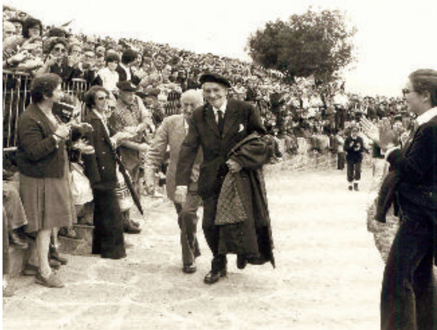
Irujo destacó por su vitalidad y dinamismo político.

Irujo incorporó a sus planteamientos políticos una línea de pensamiento federalista y europeísta. En esta vertiente fue autor de textos doctrinales, trabajos de