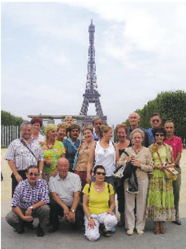
París fue uno de los lugares que más gustó a nuestros ganadores

Como ganadores de la segunda edición del Premio Civis, tuvimos la oportunidad de conocer ‘in situ’ el funcionamiento de la Unión Europea. Empezamos nuestro viaje en París, ciudad que siempre merece una visita para continuar después el viaje hacia Bruselas. La primera institución que nos recibió fue el Parlamento Europeo, ‘la voz del pueblo’. El programa de la visita incluía una charla-coloquio sobre el funcionamiento de esta institución que resultó muy interesante. Esa misma tarde conocimos el Comité de Regiones, ‘la voz de las regiones’, creado en 1991 en el Tratado de Maastricht. Mediante este órgano, las