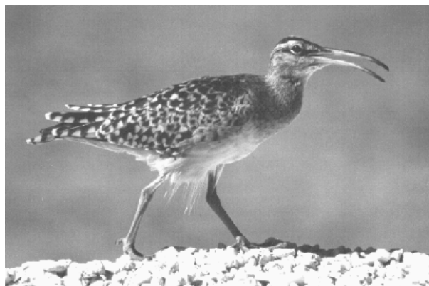
Numenius tahitiensis (Tahanea)

Remarquons que les oiseaux les plus recherchés étaient le Bécasseau polynésien ( Aechmorhynchus cancellatus ) et le Courlis d'Alaska ( Numenius tahitiensis ).