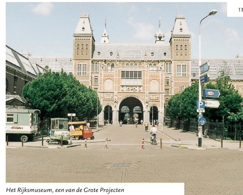
Het Rijksmuseum, een van de Grote Projecten

At the turn of this century, the Chief Government Architect set himself the goal of launching ten major projects – and in fact, this actually is the agenda for the new century. Ten large-scale projects which comprise the infrastructure (the A12 motorway), spatial planning (re-designation of sandy ground and the Delta Metropolis) and our national heritage (the Rijksmuseum and the Nieuwe Hollandse Waterlinie), amongst others. Not only do these projects symbolise the agenda for the future, they also reflect the agenda of today, since the demand for space in the Netherlands is enormous and involves an ongoing battle between culture and nature, past and present. Although the hand of the Chief Government Architect may no longer be as visible as it was a century ago, he is still immensely influential. And that influence extends well beyond the drawing table.