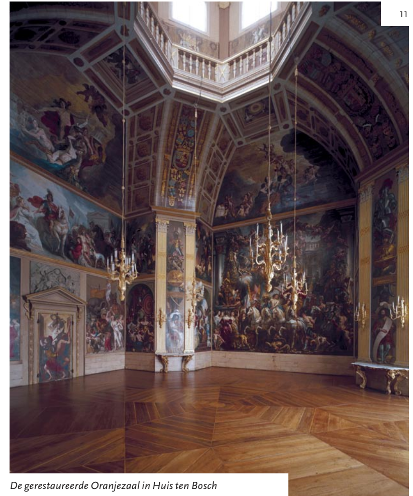
De gerestaureerde Oranjezaal in Huis ten Bosch

Tax offices, courts, ministries and other public buildings in the Netherlands have always been traditionally designed by the Chief Government Architect in the past. However, the privatisation of many government agencies over the past 20 years has changed the nature of his duties. These days, the Chief Government Architect is expected to exercise more indirect influence across a wider area – one that is no longer confined to buildings alone. Infrastructure and landscape, for example, are now also part of his brief. So how exactly do we recognise the work of the Chief Government Architect, and what is the essence of his role?