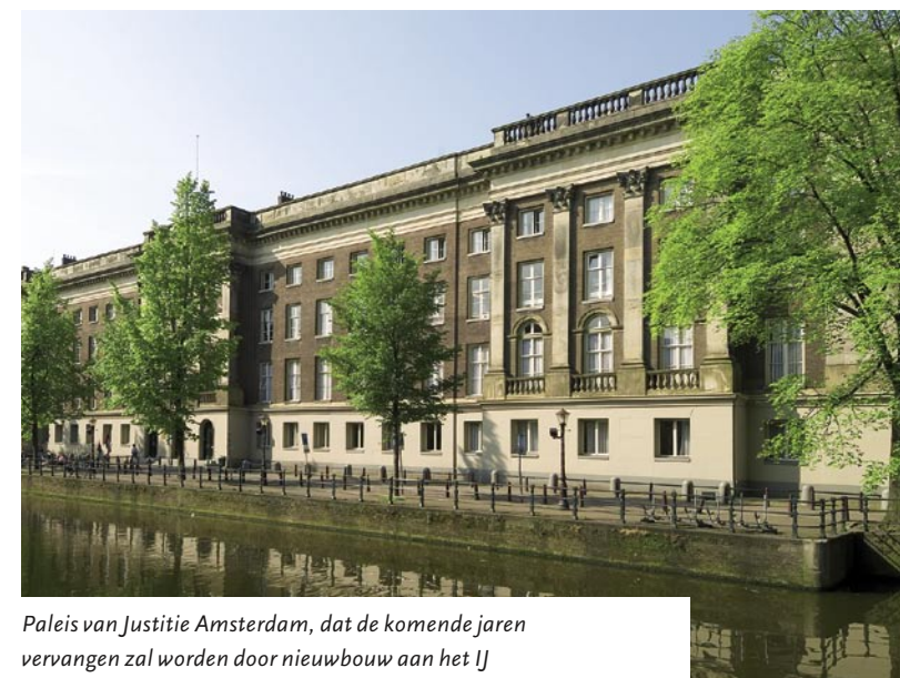
Paleis van Justitie Amsterdam, dat de komende jaren vervangen zal worden door nieuwbouw aan het IJ