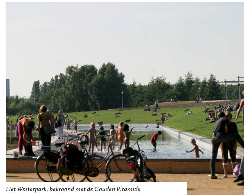
Het Westerpark, bekroond met de Gouden Piramide