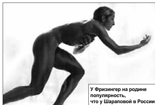
У Фризингер на родине популярность, что у Шарповой в России.