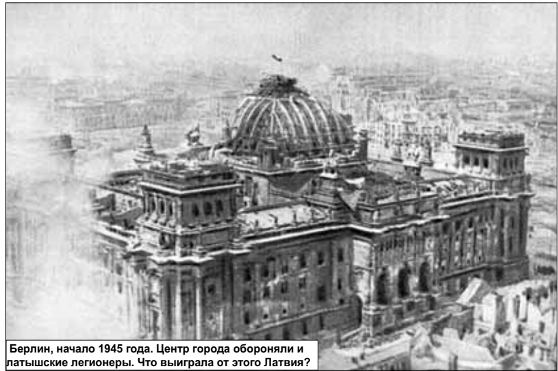
Берлин, начало 1945 года. Центр города обороняли и латышские легионеры. Что выиграла от этого Латвия?

Чтобы не быть обвиненным в «повторении тезисов советской пропаганды», стану использовать исключительно цифры из официальной книги «История Латвии. XX век». Той самой, которую Вайра Вике-Фрейберга умудрилась подарить Владимиру Путину. Что же говорится в издании, призванном сломать старые стереотипы? Первый латвийский пронацистский батальон был сформирован еще осенью 1941 года. Как известно, фашисты любили говорить оруэлловским языком (типа: мир - это война). Официально латвийская воинская часть именовалась батальоном службы порядка. Но уже в октябре ее отправили на Восточный фронт как обычный армейский отдельный батальон. Как подчеркивается в книге «История Латвии. XX век»,