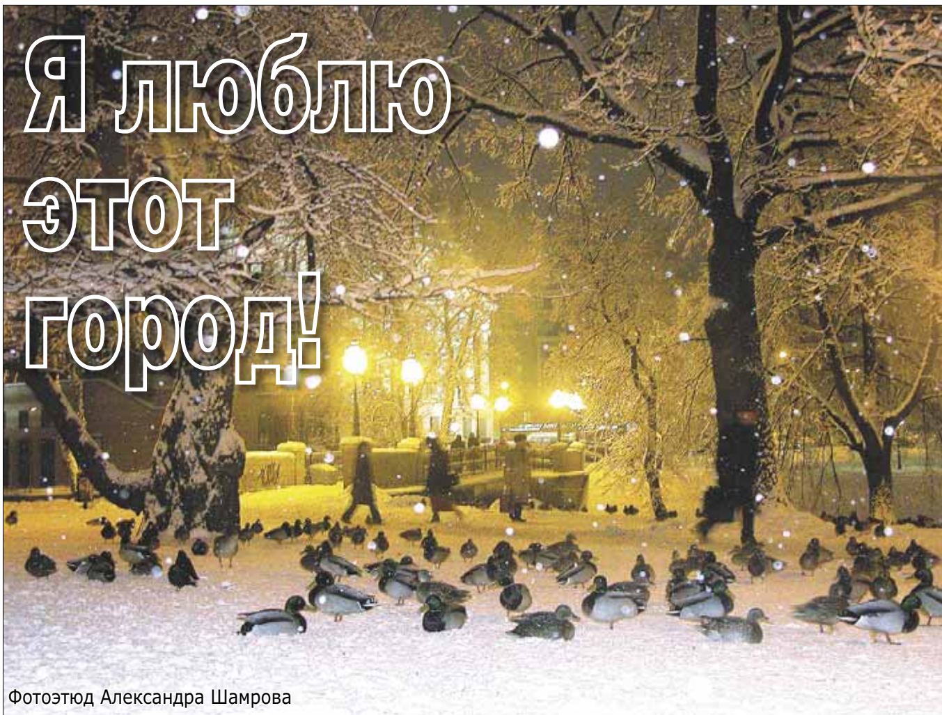
Фотоэтюд Александра Шамрова