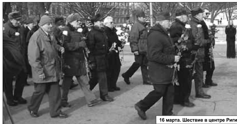
16 марта. Шествие в центре Риги.

решил выслушать мнение своих местных пособников. Представители самоуправлений даже не пытались просить независимости в обмен на латышские дивизии, а лишь клячили о мелких уступках. Например, жаловались на... национализацию. Речь шла о фабриках, торговых предприятиях и землях, которые советская власть объявила госсобственностью, а немецкие оккупанты сочли своей военной добычей. Директора самоуправлений уверяли: