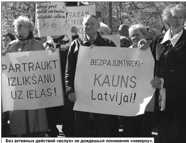
Без активных действий «вслух» не дождешься понимания «наверху».

Мы будем настаивать на том, чтобы государство разработало нормативные акты по обожествлению жилья. Чтобы в этих законодательных актах были учтены интересы жильцов, необходимо представительство жильцов в составе комиссий по разработке законодательных актов и специалистов по коммунальному хозяйству. Нужен также ликбез для жильцов по разъяснению их прав и способов, с помощью которых можно отстаивать свои права в судебных и государственных