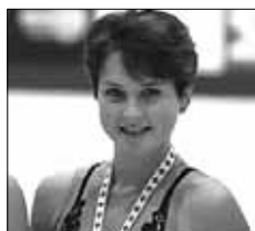
Слуцкая повторила судьбу другой великой фигуристки Мишель Кван - так и не стала олимпийской чемпионкой.

Чемпионка мира 2004 года японка Сизуки Аракава произвольную программу откатала прекрасно, допустив лишь одну ошибку - вместо тройного риттбергера сделала