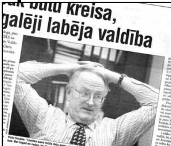
Эще американский политолог (на снимке) сказал, что лучше бы к власти пришло левое правительство или коалиция с левыми. Запад потому что крайне правых и экстремистов не признает, видите ли.