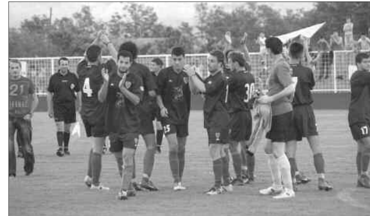
Navikli na radovanje: Fudbaleri Zete nakon posljednjeg trijumfa na Trešnjici protiv Sutjeske