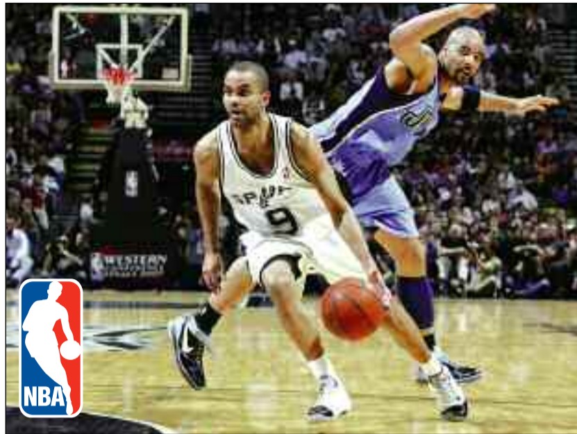
Toni Parker predvodio San Antonio do druge pobjede

Sparsi, međutim, ponovo nijesu dozvolili preokret. Brus Bouen pogodio je u tim trenucima dvije trojke za novo ubjedljivo vodstvo domaćih.