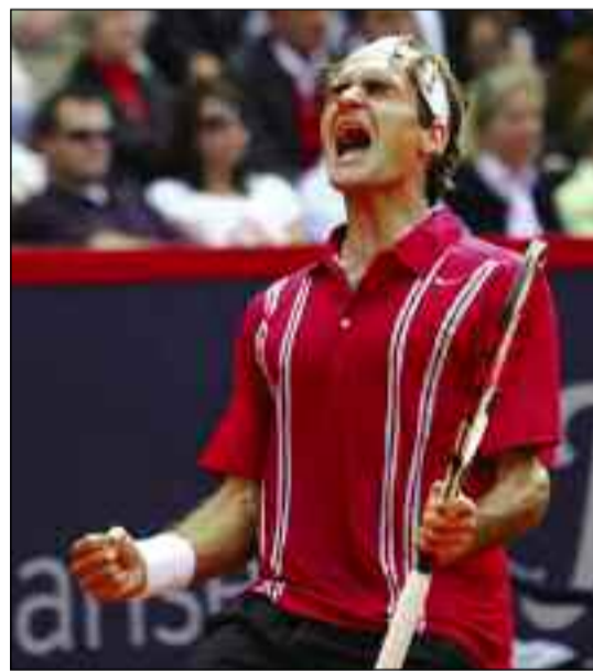
Prvi reket svijeta: Rože Federer

Inače egzibicioni dvoboj biće odigran 22. novembra u sklopu proslave nezavisnosti Malezije, koja će uključivati i promovisanje turnira Malezija Open, kao i drugi po redu čelindžer turnir.