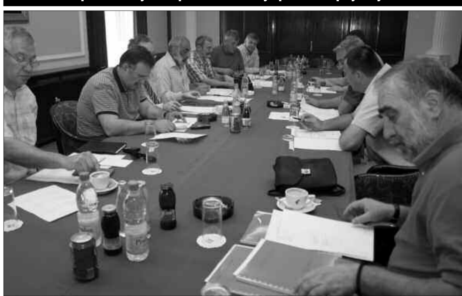
Sa jučerašnjeg sastanka u Podgorici

Seniorska reprezentacija već počela da dobija pozive za prijateljske utakmice