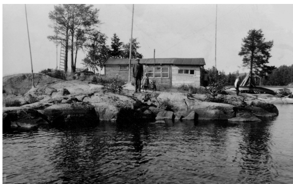
Bild 2 ”Kalle Stina” på ”Fläsklösen” med sina antenner i bakgrunden.

”Kalle Stina” som också var en hängiven radiolyssnare hade rest tre antennmaster på ön, lyssnade gjorde han med en kristallmottagare.