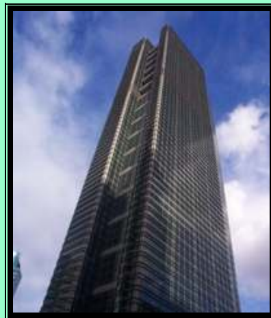
Edificio de la Bolsa, en Manila

Nota publicada por ICEX que contiene información sobre el régimen de comercio exterior (importaciones y exportaciones), la regulación de cobros y pagos con el exterior y otros aspectos regulatorios.