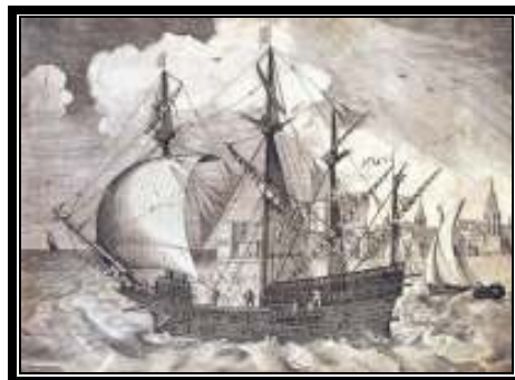
“El Galeón de Manila”.