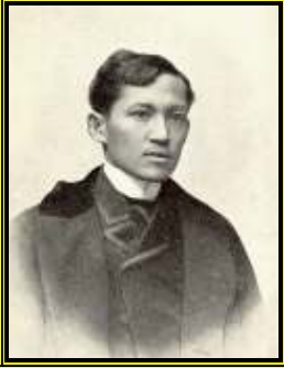
José Rizal y Alonso

De algunos años a esta parte el porvenir de aquellas islas preocupa, no sólo a sus habitantes que son los que están más interesados, sino también a muchos peninsulares que hasta hace muy poco ignoraban quizás su situación geográfica y la raza que las habita, etnográficamente hablando.