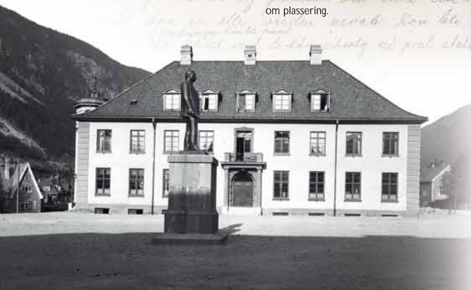
Statuen midt på torget 1925, Norsk Folkemuseums billedsamling. Fotograf: Anders Beer Wilse