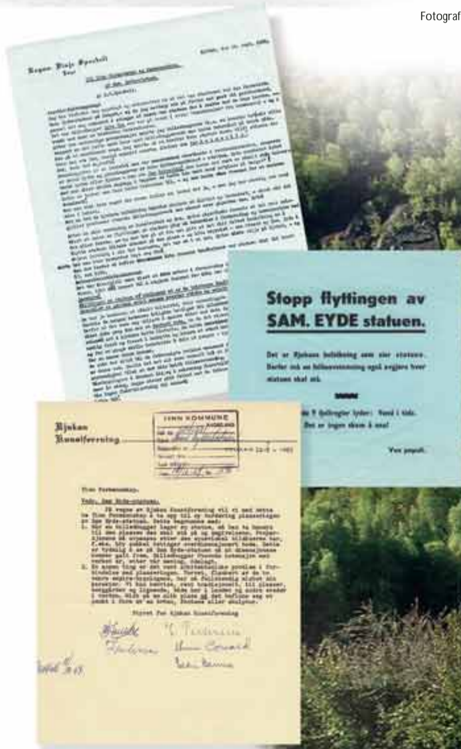
Brev fra Spoceli til kommunestyret Løpeseddelen som ble spredt rundt om natten med budskap om å stoppe flyttingen Brev fra Rjukan kunstforening