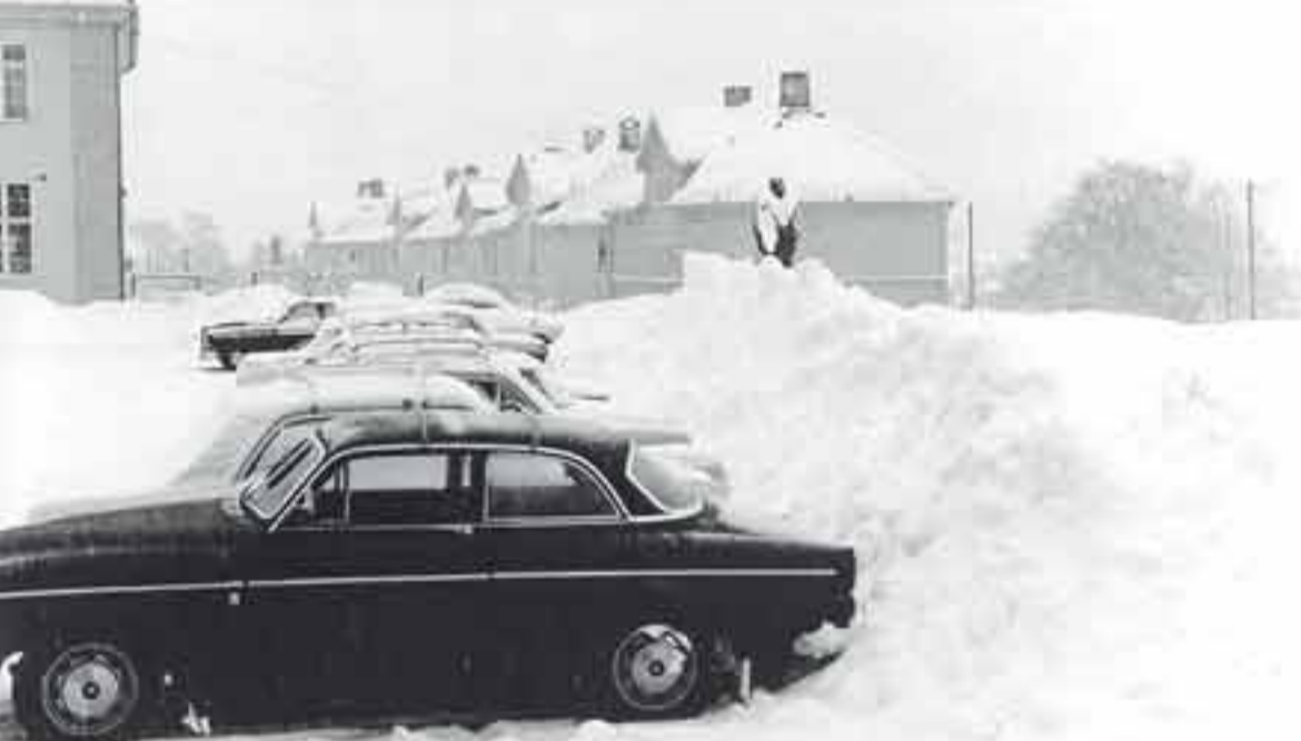
Statuen i torgets østre hjørne 1967.