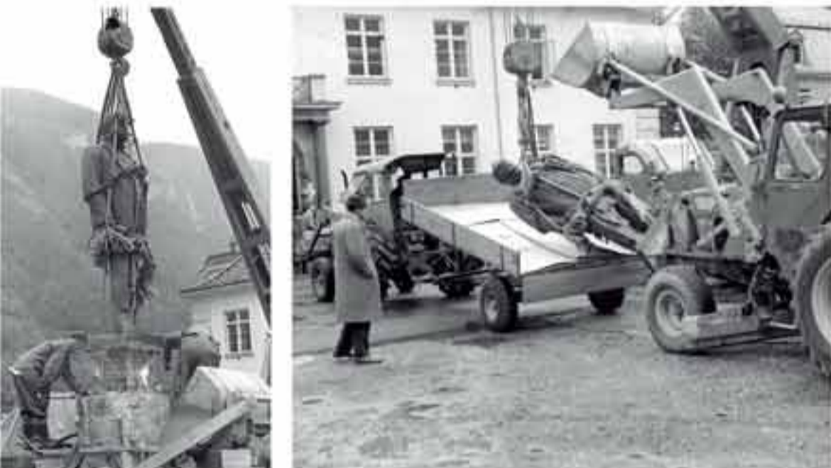
Statuen rives 1967.