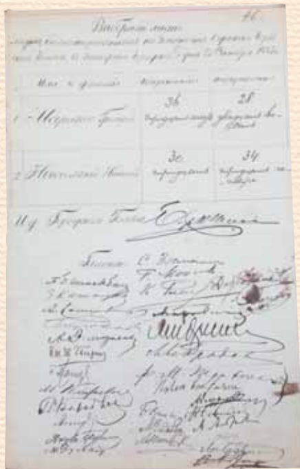
Виборний лист балотування Г.Г. Маразлі на посаду одеського міського голови. 1885 р. (Державний архів Одеської області).

Η νέα του προαγωγή του έδινε πλέον το δικαίωμα να λάβει τίτλο ευγενείας, που το άσκησε αμέσως υποβάλλοντας αίτηση αναγνώρισης κληρονομικού τίτλου ευγενείας στη Γερουσία της Ρωσικής Αυτοκρατορίας. Τον Ιούνιο του 1875 η Γερουσία, με διάταγμα που εξέδωσε, έδωσε εντολή προς τη Συνέλευση των Ευγενών του Κυβερνείου της Χερσώνας να καταχωρίσει το όνομα «Μαρασλή» στο τρίτο τμήμα του γενεαλογικού μητρώου των Ευγενών. 7 Στις αρχές του 1876 η υπηρεσία οικοσημολογίας ενέκρινε το οικοσημό