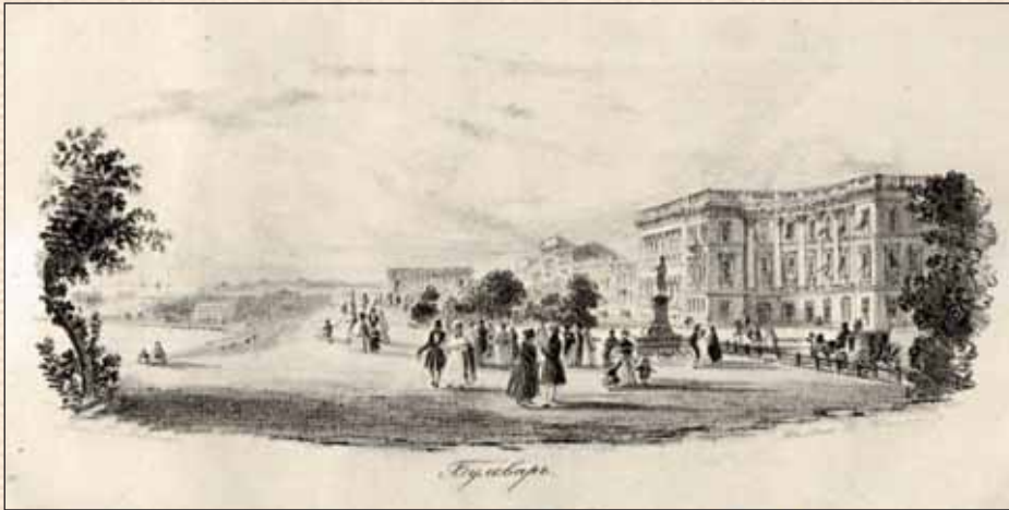
Μικολαΐθςκιη βυλβάρ β Οδεσί