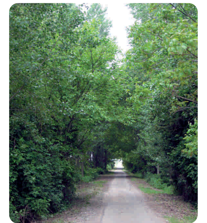
Chopera en Tirgo

Valores naturales: Amplia llanura aluvial con un paisaje agrícola intensamente ocupado por cultivos de cereal y de regadío como patatas y remolachas . Bajo su superficie se encuentra el denominado acuifero del Oja , un importante acuifero del que se abastecen, mediante pozos, los regadíos de la zona. Junto al río Oja aparecen, además, cultivos de chocho y restos de saucedas arbustivas naturales.