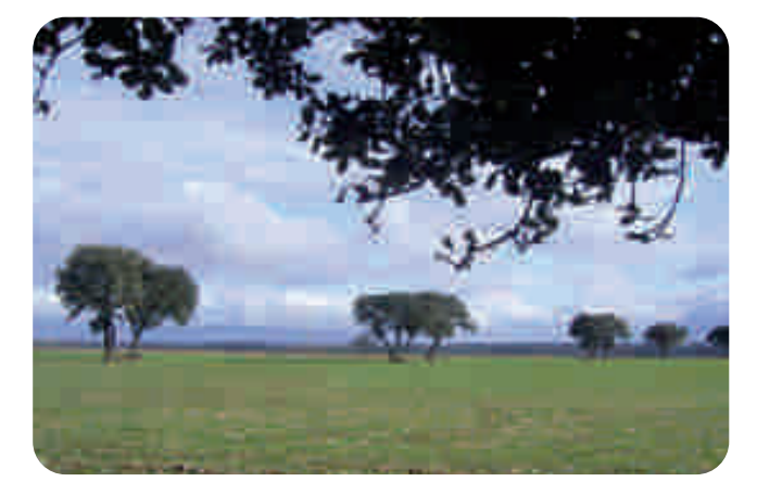
Encinas en Bañares

En Santo Domingo de la Calzada encontramos el Camino de Santiago, que cruza la localidad en su discurrir desde Nájera hasta Grañón, donde sale de La Rioja.