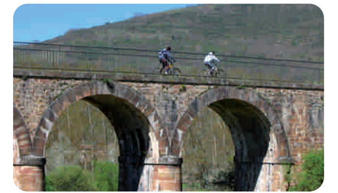
Puente en Ojacastro

Cruzamos la LR-413 y llegamos a una pasarela sobre el arroyo de Santurdejo . Atravesamos la carretera a Santurde (LR-414) y, a partir de aquí nos acercamos a la Sierra. Vamos junto a un talud densamente cubierto de vegetación ; el trazado discurre a media ladera con rebollos y pinos a la derecha. Al cabo de un par de kilómetros pasamos junto a una explanada acondicionada con bancos, cruzamos una pista que sube a San Asensio de los Cantos y atravesamos el barranco de Ularna por un puente metálico.