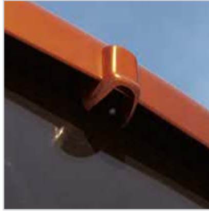
Geri görüş kamerası