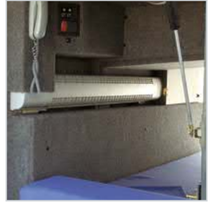
Konforlu yedek sürücü yatma yeri

Hava körükleri, amortisör ve stabilizatörlerle desteklenmiş süspansiyon sistemi, Temsa Diamond'a sessiz ve sarsıntısız bir sürüş sağlıyor. Standart olarak sunulan ABS, ASR ve Retarder, Temsa Diamond'ı son derece güvenli kılıyor. Ayrıca isteğe göre ESP donanımı da eklenebiliyor.