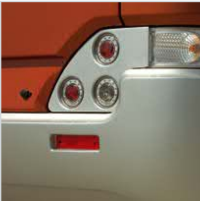
Sportif görünümlü sinyal sistemi

Hava körükleri, amortisör ve stabilizatörlerle desteklenmiş süspansiyon sistemi, Temsa Diamond'a sessiz ve sarsıntısız bir sürüş sağlıyor. Standart olarak sunulan ABS, ASR ve Retarder, Temsa Diamond'ı son derece güvenli kılıyor. Ayrıca isteğe göre ESP donanımı da eklenebiliyor.