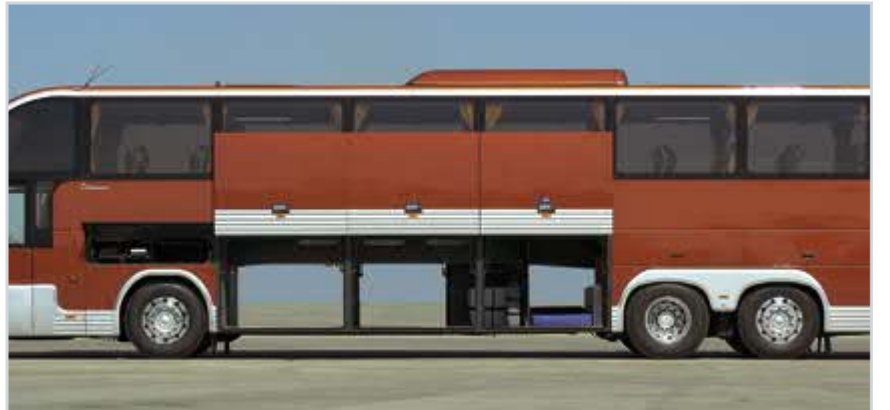
Yedek sürücü yatma yeri ve geniş bagaj