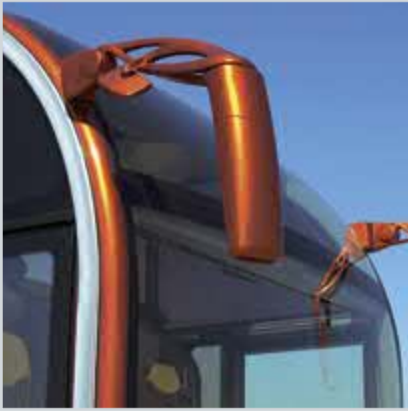
Mükemmel görüş sağlayan aynalar

Teknoloji, konfor ve güveni bir araya getiren üç akslı Temsa Diamond, 460 beygir gücünde, ekonomik ve çevreye duyarlı EURO 3 motoru ile yüksek performans kazanıyor. Yüksek tork değerine sahip bu motor sayesinde, üç akslı Temsa Diamond, değişen topografik yol koşullarına uyum sağlıyor, rampa ve düz yollarda güç kaybetmeden vites değiştirebiliyor.