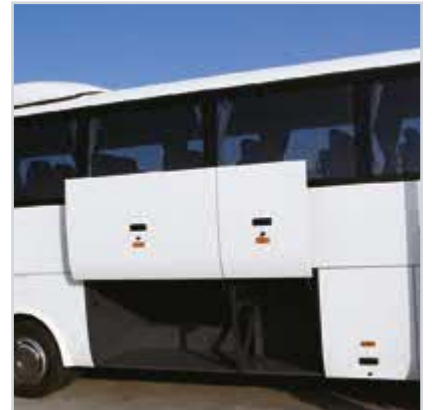
Geniş bagaj hacmi