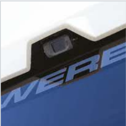
Geri görüş kamerası

Temsa Powerbus'ta aracın ani frenlerde kaymasını engelleyen ABS ve frenleri aşındırmadan düşük hızlarda gidebilmesini sağlayan Retarder gibi sürüş güvenliğini artıran teknolojik donanımlar standart olarak bulunuyor. Sıkışan herhangi bir nesneyi otomatik olarak algılayıp kapıyı açan Akıllı Kapı Sistemi, Temsa Powerbus'ın kazaları önleyen ve emniyeti artıran bir diğer özelliği.