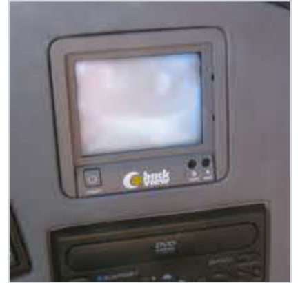
Geri görüş monitörü

Temsa Powerbus'ta aracın ani frenlerde kaymasını engelleyen ABS ve frenleri aşındırmadan düşük hızlarda gidebilmesini sağlayan Retarder gibi sürüş güvenliğini artıran teknolojik donanımlar standart olarak bulunuyor. Sıkışan herhangi bir nesneyi otomatik olarak algılayıp kapıyı açan Akıllı Kapı Sistemi, Temsa Powerbus'ın kazaları önleyen ve emniyeti artıran bir diğer özelliği.