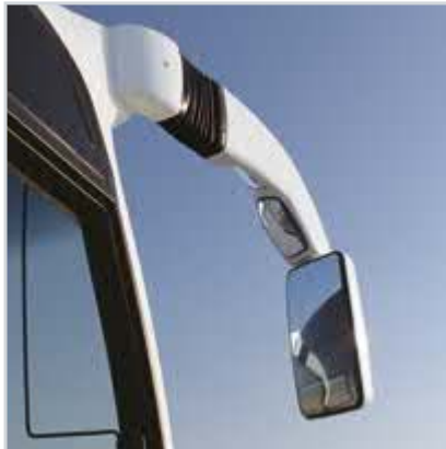
Mükemmel görüş sağlayan aynalar