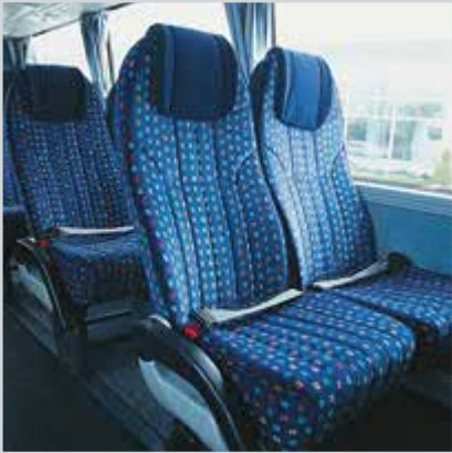
Emniyet kemeri standart

Powerbus'ın 4580 cm 3 'lük, 4 silindirli, turbo intercooler'lı dizel motoru hem ekonomik, hem de çevre dostu. Motor, 2400 devirde 180 beygirlik güç üretiyor.