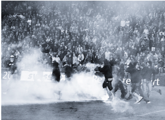
Ausschreitungen im Stadion. Nach dem Fussballspiel zwischen dem FC Basel und den FC Zürich am 13. Mai 2006 stürmten Chaoten im St. Jakobpark das Spielfeld.