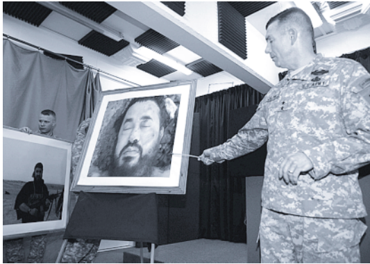
Erfolgsmeldung in Krieg gegen den Terrorismus. Der Sprecher des US-Militärs im Irak gibt am 8. Juni 2006 an einer Medienkonferenz die Tötung Abu Mussab az-Zarqawis bekannt.

beobachtet und deren Gewaltpotenzial als relativ hoch eingeschätzt. Die Bedrohungsanalyse fällt jedoch unterschiedlich aus.