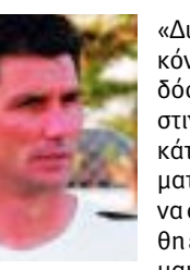
Οι παίκτες μου έχουν μεγαλύτερη δυνατότητα και αυτό το έδειξαν στο β' μέρος, απέναντί σε μια Ομόνοια που βρισκείται στο ίδιο επίπεδο με εμάς».