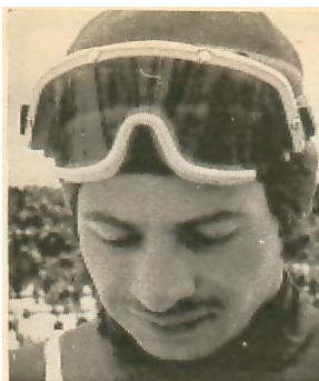
Karl Scanabl Copyright Lahti Hiihtomuseo