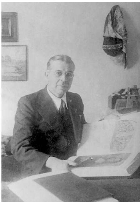
С. И. Вавилов за чтением книги о Леонардо, которую он держал ночью под подушкой. ГОИ. Йошкар-Ола, 1943 г.