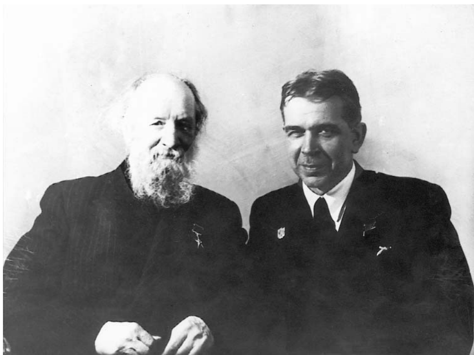
А. Н. Крылов и С. И. Вавилов во время юбилейной сессии АН СССР, посвященной 220-летию, 1945 г.