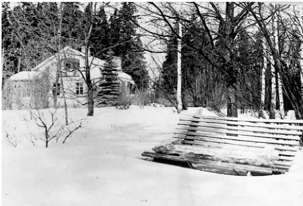
Дача С. И. Вавилова в Можжинке (Звенигород). сделанное в год присуждения Нобелевской премии, 1958 г.