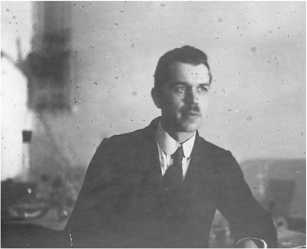
С. И. Вавилов ≈ 1922–1923 гг.

вых архитекторов, работавших всегда вместе.