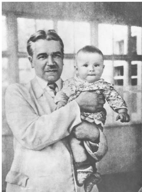
С. И. Вавилов с внуком Сережей ≈ сентябрь, 1949 г.