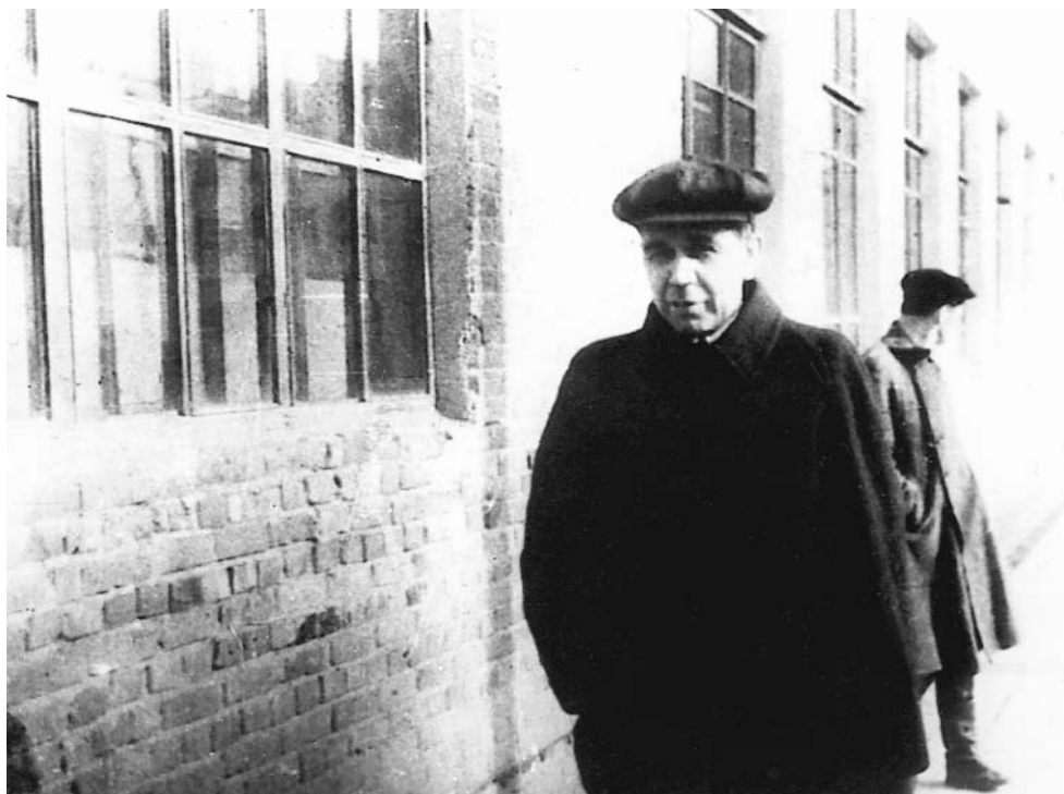
С. И. Вавилов в Йошкар-Оле в годы войны. По дороге в Оптический институт..

ворят. Город наполнен аферистами, ловящими рыбу в мутной воде. Пользуются тем, что люди, учреждения на востоке, грабят имущество. Каждый день ходил по генералам, главным инженерам. Толкотня по улицам, метро, трамваи. Люди автоматические.