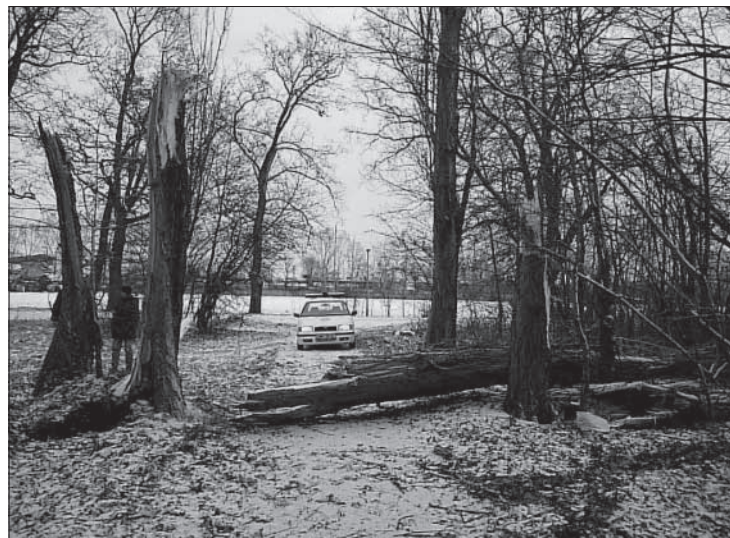
V aleji u velodromu spadl strom přes cestu. (text mm)

Louny (mm) – V pátek 16. prosince zasáhl také Louny velmi silný vítr. Po 15. hodině přijali strážníci oznámení, že v ul. Na Valích se z jednoho domu utrhla kovová věžička a visí na domě. Protože hasiči byli již na jiných výjezdech, strážník zajistil místo proti vstupu osob. Krátce na to se odlomila část střechy z kostela v ul. Na Valích a zůstala viset na okraji střechy. Služebním vozidlem byla uzavřena ulice. Asi za půl hodiny se dostavili cítilibští hasiči, kteří si prostor převzali. Po 16. hodině bylo strážníkům oznámeno padání střešní krytiny z budovy Okresního soudu v Lounech v ul. Poděbradova. Na místo ihned vyjela hlídka