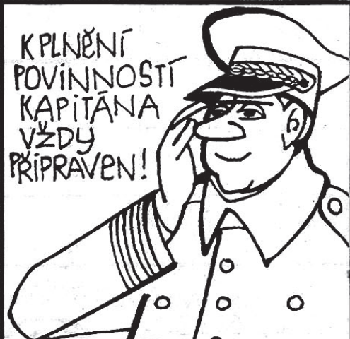
Kapitán opouští loď poslední. Někdo přece musí ...