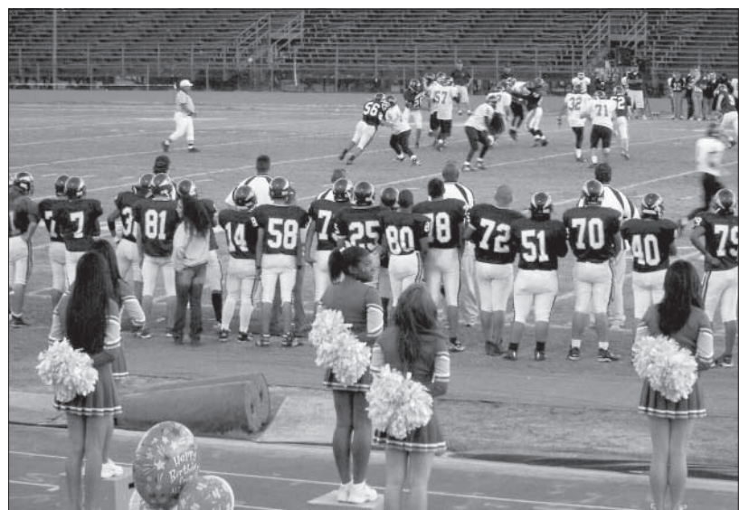
Pochopit pravidla amerického fotbalu jsem se ani nesnažila, ale pro některé chlapce bylo asi větším zážitkem fandění rozléskavaček.

den ze svých zdánlivě nespílitelných snů. Na opravdový zápas jsem se tedy já dostala až na Dodger stadion na base-