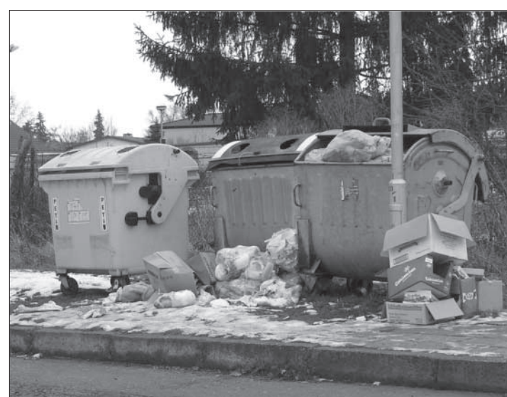
Přestože v Podbořanech je v současné době rozmístěno několik desítek plastových kontejnerů na tříděný odpad, mnozí jakoby stále tápali, nač ty barevné "popelnice" jsou. Co nepotřebují, neženze neroztrídí, ale je jim i za těžko vložit odpad do kontejneru. Na snímku je "smetiště" v blízkosti samoobsluhy RULF v Podbořanech.

veřejné diskusi objeví několik dobrých nápadů, jak se účinně vracet k recyklaci,“ nastínil Antonín Terber jeden z konkrétních cílů začínající informační kampaně. Do třídění komunálního odpadu je již intenzivně zapojeno 320 měst a obcí Ústeckého kraje - díky projektu, se do třídění odpadů zapojilo dalších 31 obcí. V současné době obyvatelé Ústeckého kraje vytrídí 14,99 kg odpadů osobu/rok (bez kovů) oproti 12,04 kg osobu/rok v loňském roce. V roce 2005 bylo celkem instalováno 785 nádob do 108 obcí v kraji, přičemž u tří obcí se podařilo rozšířit sběr tříděného odpadu na všechny tři komodity, u tří obcí se zavedl nádobový systém tříděného sběru, deset obcí zkušebně zavedlo sběr bílého skla a celkem 31 obcí doposud vůbec odpady netřídilo a díky výpůjčce nádob začal systém třídění odpadů fungovat. (tkú)