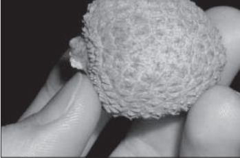
Plody liči.

vrchu hrubolaté bradavičnatá a šupinatá. Na sluníčku bývají plody rudo červené až hnědé barvy, ve stínu jsou světle zelené. Po utržení zasychají a barví se do hněda. Plod je zpravidla jednodu- pouzdrý s elipsoidním černohnědým