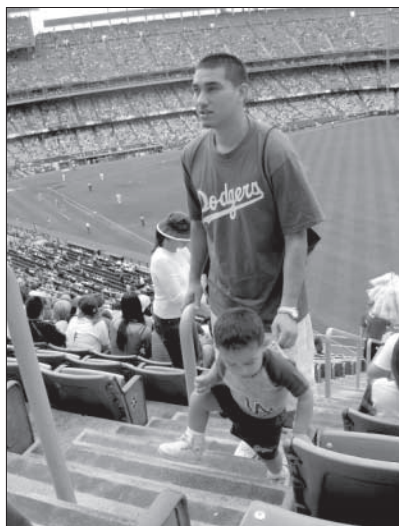
Na Dodger stadionu, kde se hraje baseball je samozřejmostí i řádné ustrojení v klubovém dresu.

né (vlajka na mávání a povzbuzování, na hlavu proti slunci, na utření hořčice atd.). Fanoušci jsou na zápas většinou oblečení do triček s nápisy klubu, dresů nebo alespoň do klubových (bílo modrých) barev. V jednotlivých patrech ochozů je plno obchodů s tímto oblečením. Vybavili jsme se tedy kšiltovkou a tričkem. Na vyhrazených "stanovištích" nás pobavili disciplinovaní Amici, kteří na vyhrazeném místě kouřili. Smoking area byla ohraničená čarou na zemi a opravdu nikde jinde kuřáci nebyli. Bylo až směšné, jak si tam všichni povinně bafali. Naše místa nebyla žádná VIP, ale měli jsme dostatečný přehled. A navíc, což jsem v průběhu pochopila, na 1. místě vůbec není sledování sportu. Myslím, že většina Američanů chodí na baseball za příjemnou atmosférou, sejít se s přáteli, zařvat si při homerunu, udělat kšičky na velkou obrazovku a hlavně se