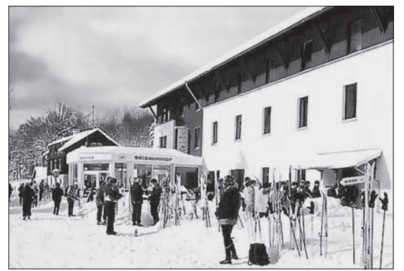
„Lyžařské nádraží“ – skibahnhof Rehfeld. (text a foto dá)

ně), 15.20 hod. (jen soboty, neděle a období 20. – 24. února a 6. – 10. března), 16.21 hod. (stejně omezení jako předchozí vlak) a 17.15 hod. (denně). Čekací doba do odjezdu vlaku se dá