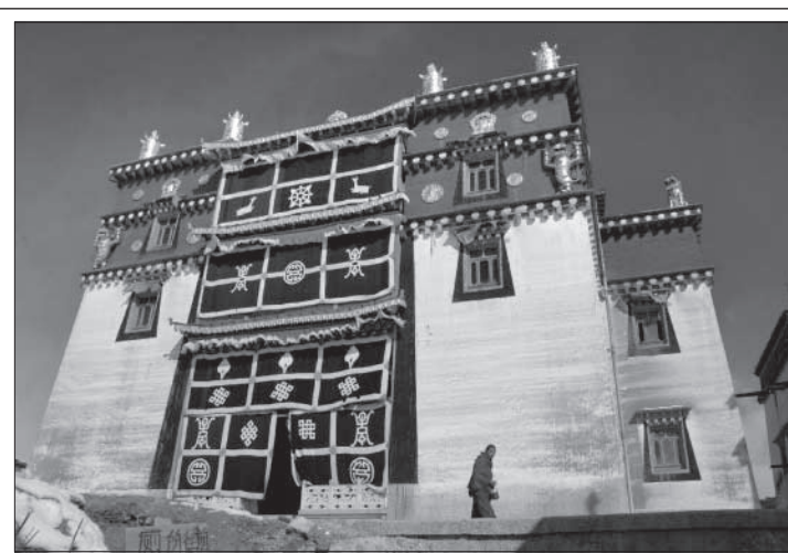
Pro cestovatele, který navštíví Tibet, je každý fotografický záběr nevšední a působivý.

Peterovu kapitolu o časech, kdy jačí karavany zajišťovaly většinu zdejšího obchodu. Cesta mezi Indií a Čínou se ukázala nesmírně důležitou a navíc ukázala světu, že pokud bude me zničení nějakou atomovou pohromou, pokorný kůň, anebo v těchto podmínkách jak, je vždy po ruce. Proto jsem si nekoupil prachovku z jačího ohonu, která sice byla jemná a náležitě exotická, ale degradovala toto podle mne ušlechtilé zvíře.