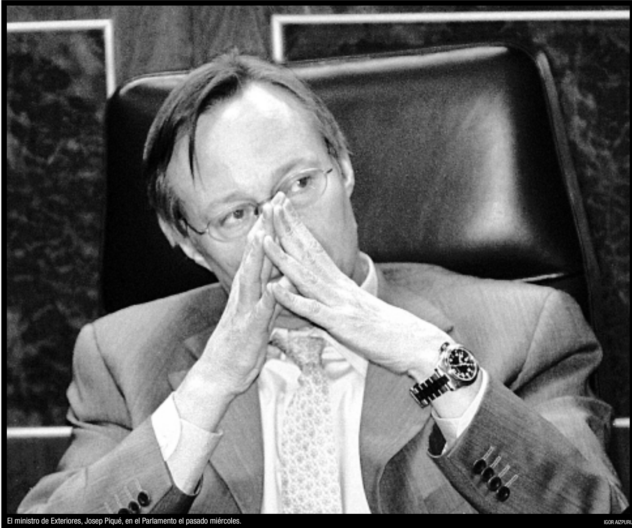
El ministro de Exteriores, Josep Piqué, en el Parlamento el pasado miércoles.

CIENCIA El imparable avance de la clonación 4 • REPORTAJE La empresa de los hermanos Castro 8