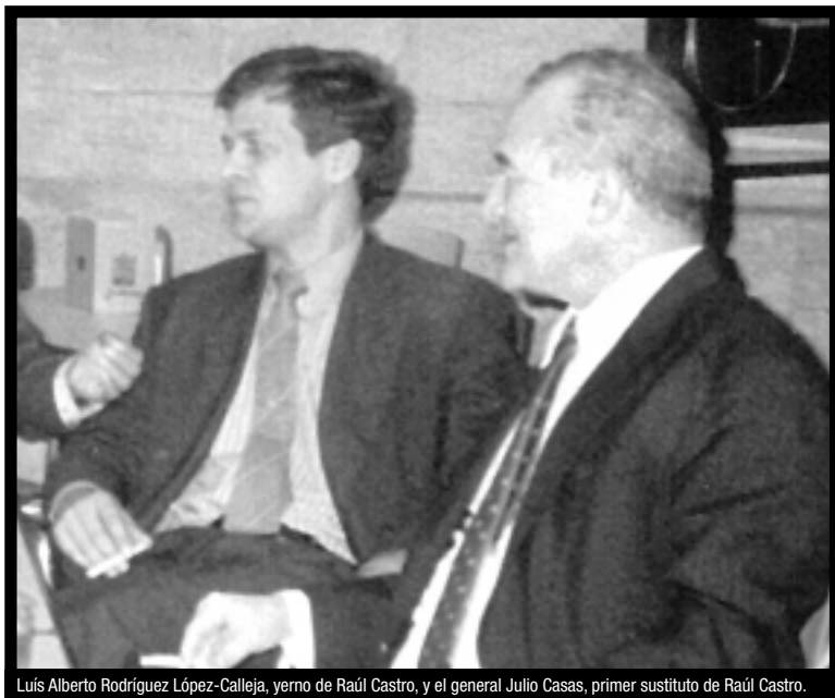
Luis Alberto Rodríguez López-Calleja, yerno de Raúl Castro, y el general Julio Casas, primer sustituto de Raúl Castro.