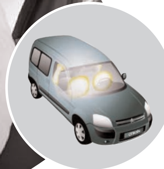
A frontális légszások, az első ülések háttámlájába épített 18 literes oldallégszások és az ajtómerevítők ütközés esetén hatékonyabb védelmet biztosítanak az utasok számára.

A nagyfrekvenciás távirányító használatakor zárás és nyitás közben az irányjelző lámpák villognak. A középkonzolon elhelyezett központizár-gombbal a gépkocsi belülről is zárható menet közben. A gépkocsi menet közbeni automatikus zárása beprogramozható.