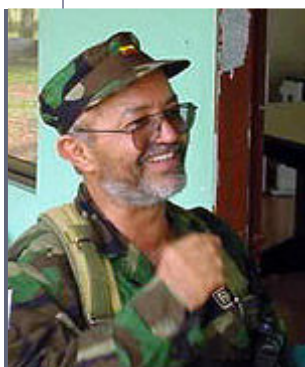
Comandante Raúl Reyes

Las Fuerzas Armadas Revolucionarias de Colombia Ejército del Pueblo FARC-EP, les hacemos llegar desde las trincheras guerrilleras, nuestro fraterno saludo bolivariano.