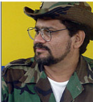
Comandante Iván Márquez

Montañas de Colombia, octubre 31 de 2007