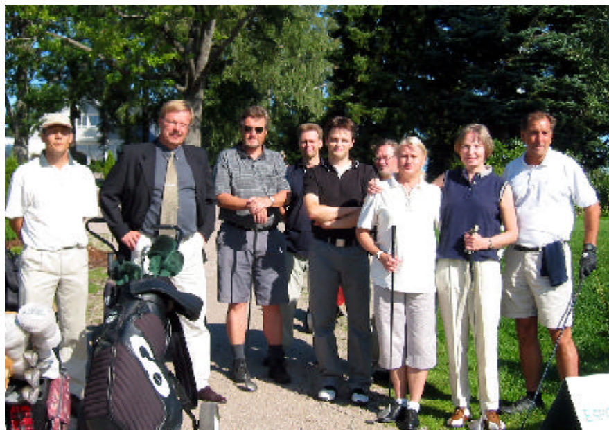
Syöttäjägolf tukee koko syöttäjälaitoksen yhteistä tyhy-toimintaa.

Syöttäjägolfin tulokset löytyvät viimeiseltä sivulta.