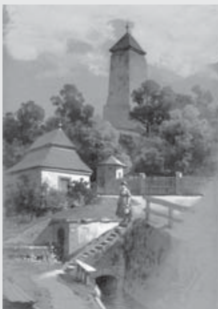
Bašta ve Vysokém Mýtě, 1905