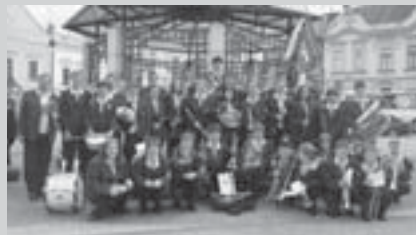
Dechový orchestr ZUŠ Vimperk, který získal druhou sponzorskou cenu - trubku od Amati-Denak.

proběhne 15. 9. - 31. 10. 2006 ve vestibulu Městské knihovny.