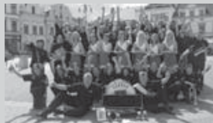
Vítěz Čermákova Vysokého Mýta Dechový orchestr ZUŠ Zábřeh

Ze všech odevzdaných hlasů v divácké soutěži byl vylosován soutěžní kupon č. 000131 . Žádáme majitele vstupenky s tímto číslem, aby se přihlásil na Informačním centru MěÚ Vysoké Mýto.