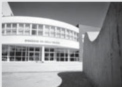
Gymnázium v Holicích

Denně kromě pondělí a úterý 9-12, 13-17 hod.