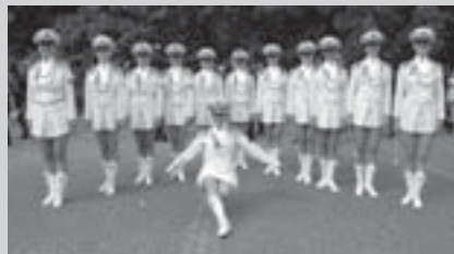
Vítězné mažoretky Rytmus Ostrava