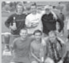
Vítězné mužstvo Javorník s putovním pohárem, foto Ladislava Pohorská.

V sobotu 13. května uspořádal osadní výbor v Brtči na hřišti turnaj ve fotbale. Šest přespolních družstev se spolu s domácími utkalo o Brtečský pohár. Ve skupině A nastoupila mužstva Paliva Choceň, Metaxa Jenišovice, Vraclav a Brteč. Ve skupině B se proti sobě postavila mužstva Litrpůl Jenišovice, Javorník a Libecina. Všechny zápasy byly vyrovnané. Ze semifinále postoupila do boje o třetí místo mužstva Metaxa Jenišovice a Libecina. Ze zápasu vyšla vítězná Metaxa se skóre 2 : 1. Držitelem Brtečského poháru se stal Javorník, který zvítězil ve finále nad mužstvem Paliva Choceň 2 : 0.