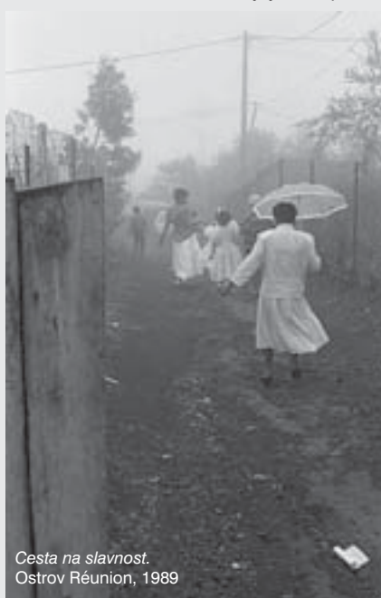
Cesta na slavnost. Ostrov Réunion, 1989

Součástí výstavy se stane i krátkodobý pobyt fotografa ve Vysokém Mýtě, kdy v rámci dvoudenního workshopu bude předávat své zkušenosti mladým fotografům. V České republice chce i fotografovat. Chystá mj. svou další knihu, tentokrát o inžitních umělcích a o umělcích z tzv. undergroundu. Výstava Bernarda Lesainga v Galerii ve Zvonici představí na 90 jeho fotografií ve speciálním výběru pro prezentaci ve Vysokém Mýtě.