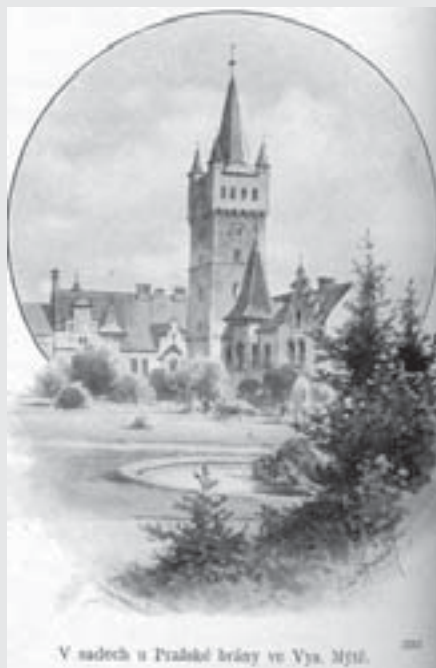
V sadech u Pražské brány ve Vys. Mýtě.