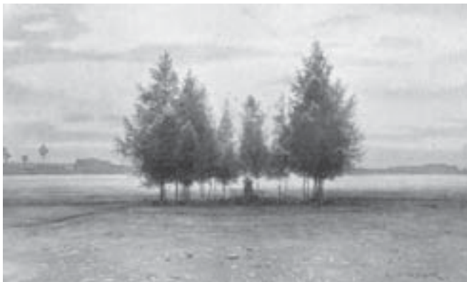
Růžový palouček kolem roku 1903. Kresba Karla Liebschera.