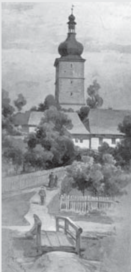
Choceňská brána, 1903