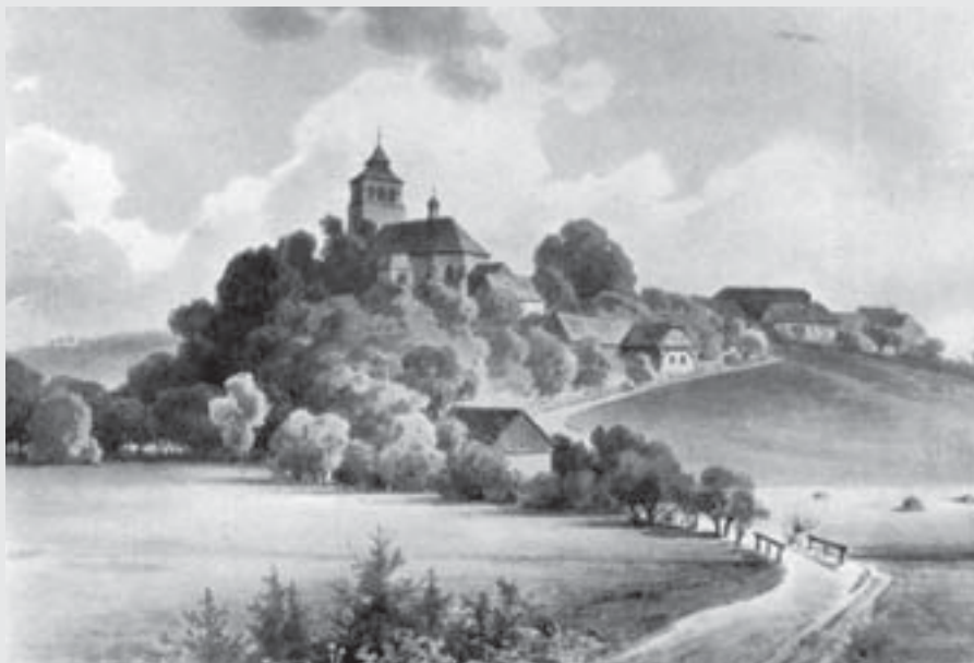
Cesta ke Knířovu, 1903