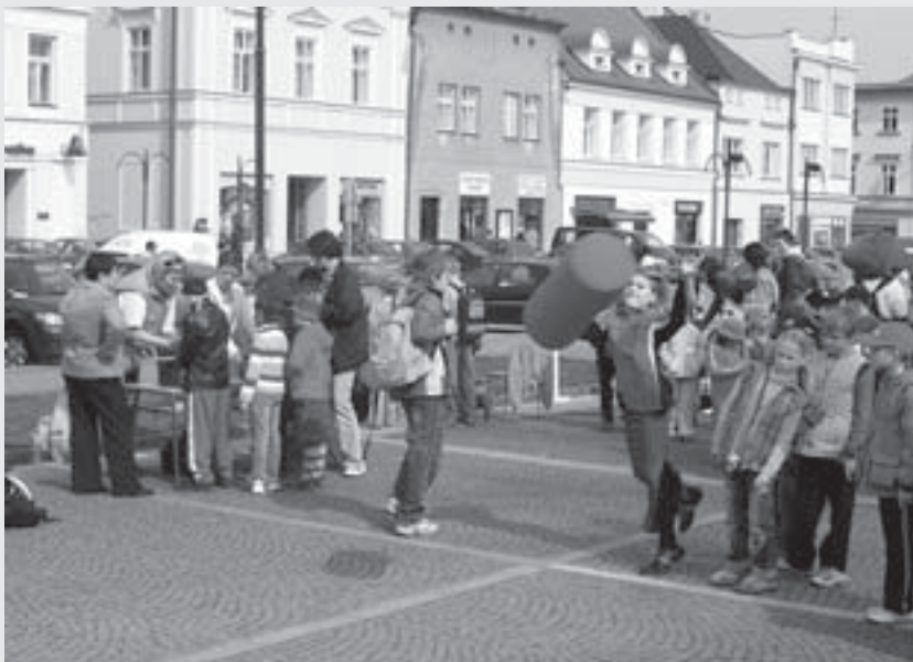
Den Země 2006.