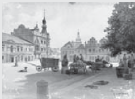
Nový Okresní dům ve Vysokém Mýtě, 1905