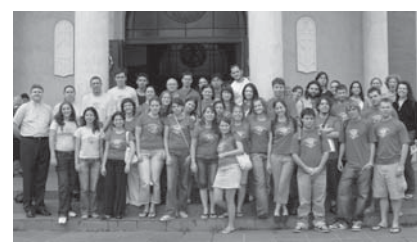
LF remiamo Pietų Amerikos lietuvių jaunimo sąjungos suvažiavimo atstovai

Lietuvių Fondo stipendijų anketos, kaip ir kasmet, priimamos iki kovo 15 d., paramos prašymų ir žiniasklaidos anketos - iki balandžio 15 d.