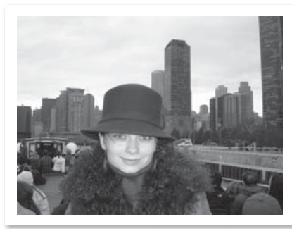
Viešniai teko apžiūrėti Čikagos išymys.