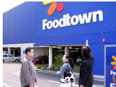
食料品スーパーへご案内