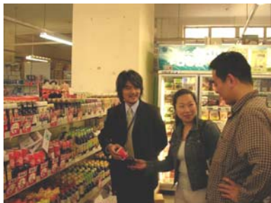
日本食材も手に入ります！

ニュージーランド下見ツアー では、現地に長期在住中の日本人スタッフがお客様を専用車で 住宅地・学校・スーパーマーケット・病院など生活に密接に関わる場所を中心にご案内致します。また、実際の視察場所はおお客様のご希望に応じてカウンセラーがオーダーメイドで作成を行います。