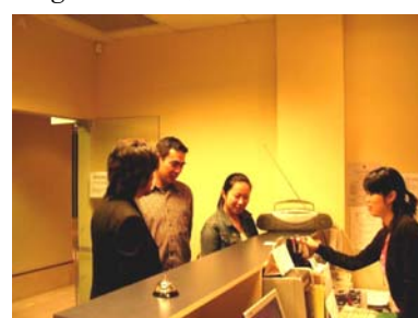
日本人看護師が常駐する病院もご紹介