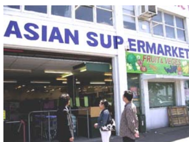
アジアンスーパーマーケット