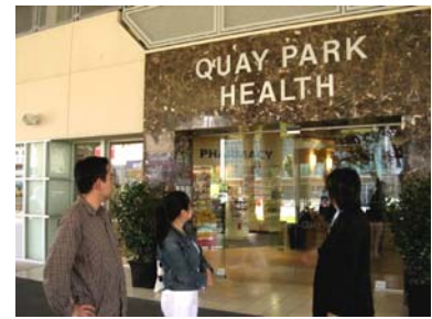
万が一のために、病院視察は安心ですね