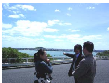
住宅街からの眺め