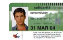
La carte solidarité transport

Cette carte est délivrée gratuitement aux bénéficiaires de la Couverture Maladie Universelle ou d'un autre régime de protection sociale basée sur la solidarité. Elle permet l'achat de tickets demi-tarif ou d'un abonnement CST mensuel ou hebdomadaire avec une réduction de 75% (décision du STIF du 11/10/2006).