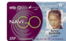
La Carte Imagine "R" étudiant ou scolaire

Dossier à retirer dans tous les points de vente ou d'accueil des transporteurs.