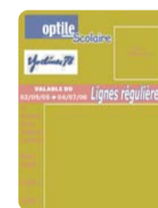
La Carte Optile scolaire

Dossier à retirer dans tous les points de vente ou d'accueil des transporteurs.