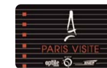
Le forfait Paris Visite

Disponible dans tous les points de vente.