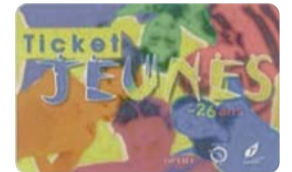
Le Ticket Jeunes week-end

Disponible dans les principaux points de vente RATP, SNCF, aéroports et principaux hôtels parisiens.