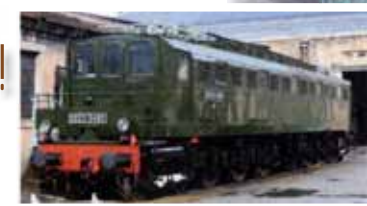
Locomotive 2CC2-3402 - Construction 1929