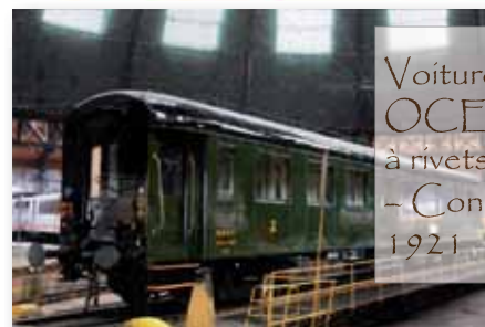
Voiture OCEM à rivets - Construction 1921