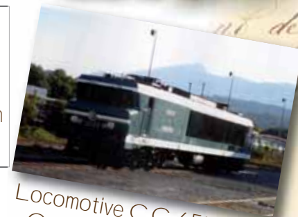
Locomotive CC 6558 - Construction 1970

Salle Viala, dès le mercredi 19 novembre