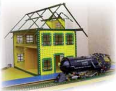
Reproduction de l'ancienne gare en Meccano

Le long du quai numéro 1, des panneaux d'information de la SNCF vous dévoileront tout ce que vous aimeriez savoir sur le pôle multimodal. RFF exposera le colossal chantier de la ligne du Haut-Bugey qui est en cours de réalisation.