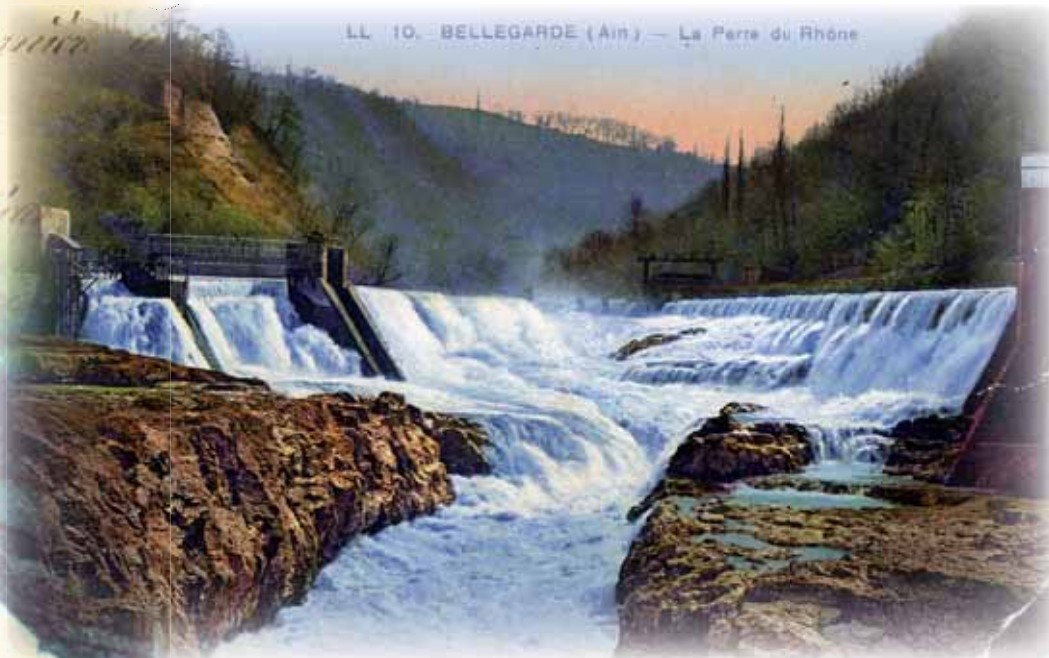
La perte du Rhône vers 1930

Au milieu du XVIII e siècle, deux belles routes «Louis XV» convergent au pont de Bellegarde. Un poste militaire et une maison de la Ferme générale y sont installés. Bientôt, relais, auberges, maréchaux-ferrants accueillent la diligence ; foires et marchés se développent. Début XIX e , gendarmes et douaniers contrôlent, à l'entrée du pont, un trafic routier transfrontalier de plus en plus important. Ainsi, au moment où le chemin de fer s'installe, la population de Bellegarde est depuis longtemps plus importante que celle de Musinens. L'activité du hameau, que l'on dirait aujourd'hui de type tertiaire, est nettement tournée vers l'avenir alors que Musinens, chef-lieu de la commune créée en 1790, s'est endormi au pied de son château à l'histoire prestigieuse.