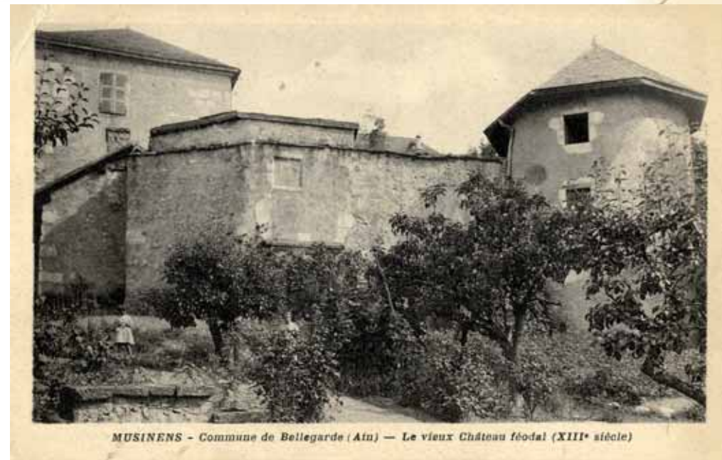
MUSINENS - Commune de Bellegarde (Ain) — Le vieux Château féodal (XIII e siècle)

Deux lieux symboliques: le château de Musinens, vestige de la cité médiévale et l'église qui devient « paroisse de Bellegarde »