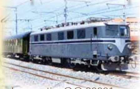
Locomotive CC 20001 - Construction 1950