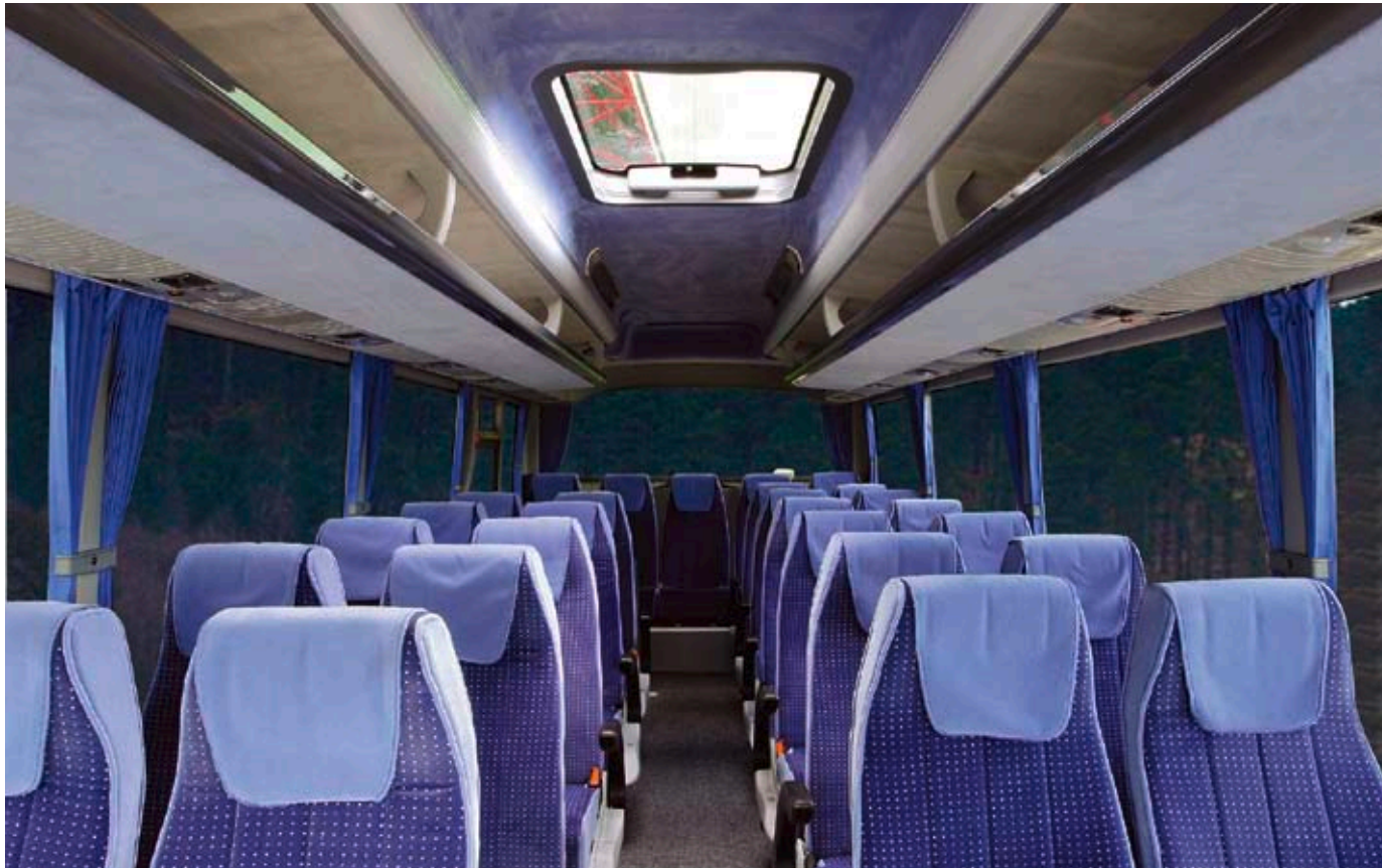
▲ Une large allée centrale, un bel espacement entre les fauteuils ergonomiques et réglables.