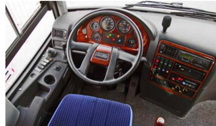
▲ Le tableau de bord ergonomique et esthétique complète agréablement le poste de conduite.

Des soutes à bagages spacieuses et faciles d'accès. ▼