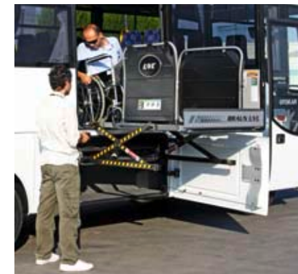
▲ La version SH permet l'accès d'un UFR. En pré-disposition, il n'y a aucune perte de places assises.