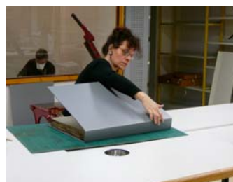
Conditionnement dans une chemise de polypropylène