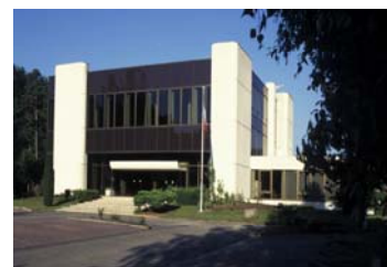
Site de Fontainebleau