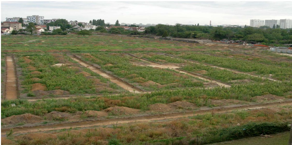
L'opération de diagnostic archéologique (août 2006)