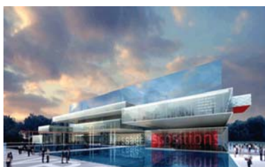
Site de Pierrefitte