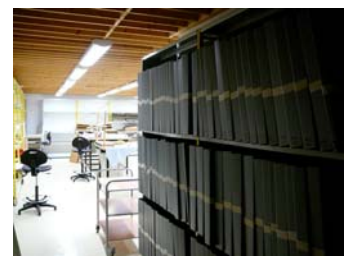
Rangement après traitement