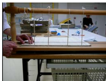
Reprise des coutures à l'aide d'un cousoir