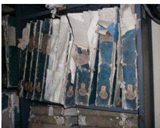
Etat de conservation initial des dos des registres

Aperçu de la chaîne de traitement des registres de la sous-série F/Préliminaire