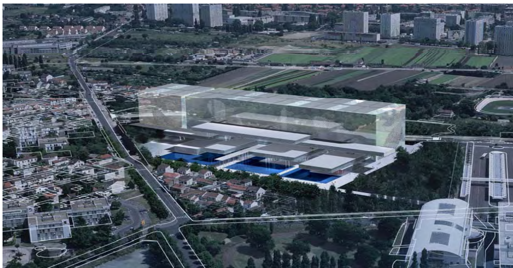
LE FUTUR BÂTIMENT DANS SON ENVIRONNEMENT URBAIN. L'ANNEXE QUI POURRA ÊTRE CONSTRUITE ULTÉRIEUREMENT EST REPRÉSENTÉE ICI

La commune de Pierrefitte-sur-Seine , au cœur de la Communauté d'agglomérations de Plaine Commune, choisie parmi cinq sites franciliens, présente de nombreux atouts. En effet, située à 14 km au nord de Paris, à 2,5 km de la Basilique royale de Saint-Denis et à proximité de l'aéroport de Roissy-Charles-de-Gaulle, elle place le bâtiment au cœur d'un réseau urbain qui le rend largement accessible à tous. Le site est desservi par la ligne 13 du métro (station Saint-Denis - Université) ; il s'insère dans un environnement scientifique et culturel avec la proximité des universités de Paris VIII et Paris XIII.