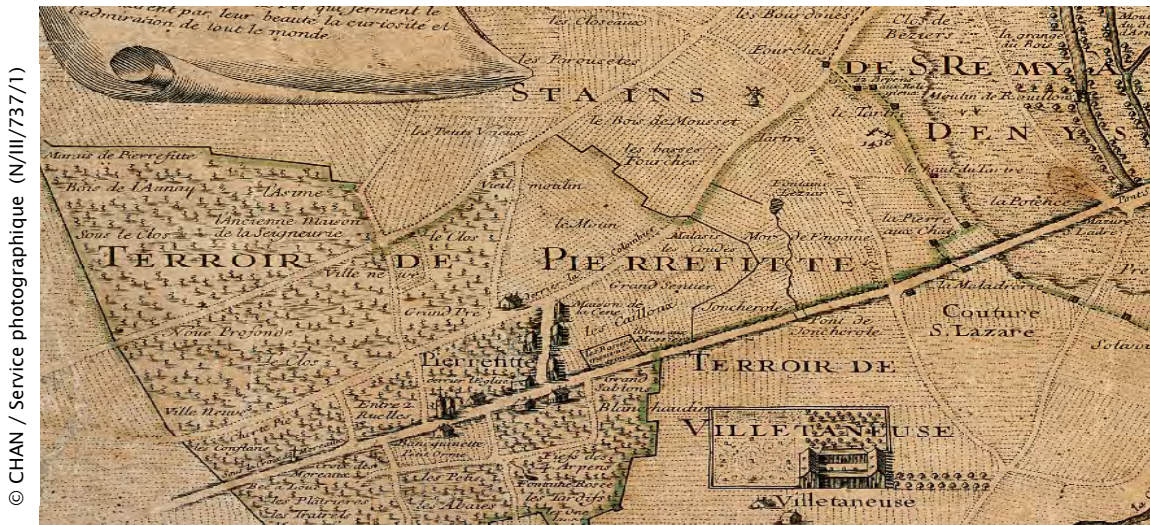
"PLAN DU TERROIR DE SAINT-DENIS EN FRANCE" 1 ER QUART DU XVIII ÈME SIÈCLE

Le futur bâtiment sera construit à Pierrefitte-sur-Seine, en un lieu nommé Les Tartres.