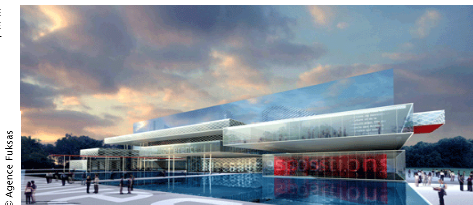
LE FUTUR BÂTIMENT DE PIERREFITTE-SUR-SEINE FAÇADE OUEST

Martine de Boisdeffre directrice des Archives de France