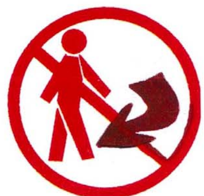
Ne pas revenir sur vos pas

Pour mieux connaître ce risque et sa prévention, consultez dès maintenant le dossier complet en mairie.