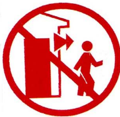
Ne pas entrer dans un bâtiment endommagé