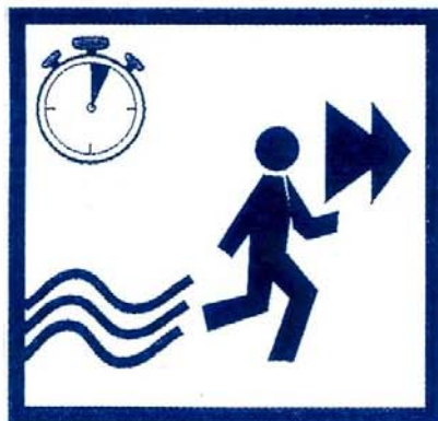
Fuyez rapidement et latéralement