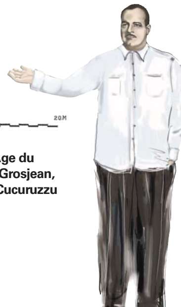
Plan de l'habitat de l'Âge du Bronze d'après Roger Grosjean, l'inventeur du site de Cucuruzzu