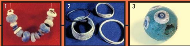
1- Collier en pâte de verre 2- Bracelets en bronze 3- Perle en verre