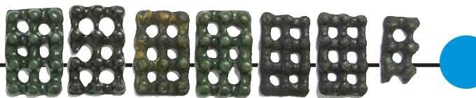
Éléments de ceinture