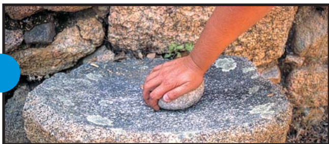
Meule à grains