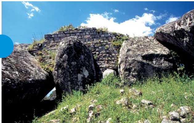
Casteddu de Capula