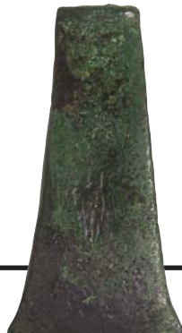
Hache en bronze

En 1991, sa restauration par l'Etat a permis d'enrayer sa dégradation et de le présenter au public de façon plus lisible. En 2004, il est transféré à la Collectivité Territoriale de Corse. ■