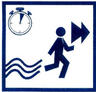
Fuyez rapidement et latéralement