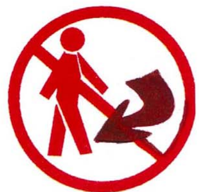
Ne pas revenir sur vos pas

Pour mieux connaître ce risque et sa prévention, consultez dès maintenant le dossier complet en mairie.