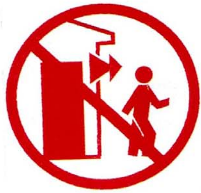
Ne pas entrer dans un bâtiment endommagé