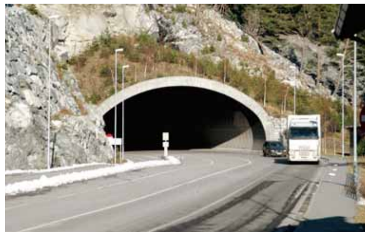
Munninga av Amlatunnelen på Mannheller er bygt ekstra brei i tilfelle oppstillingsplassen på ferjekaien blir for liten, og bilane må vente inne i tunnelen.