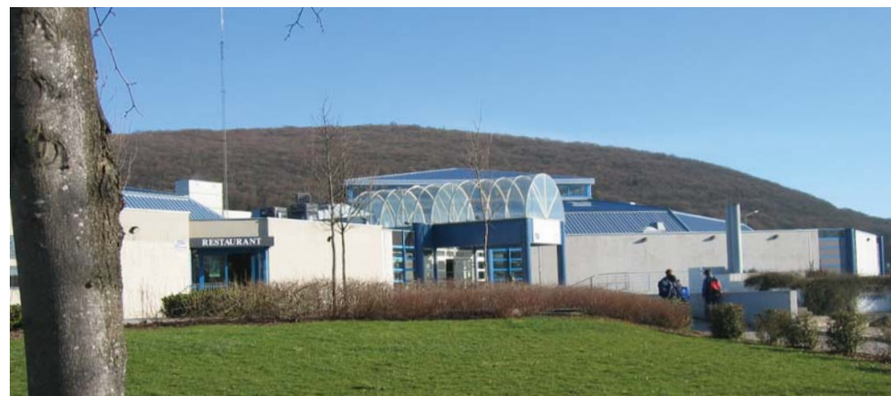
Patinoire et piscine au Parc Lafayette