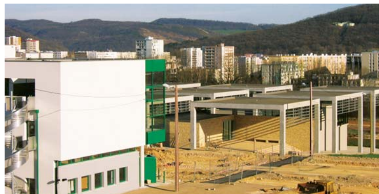
Extension du Pôle Santé

Destinée à favoriser les créations et les installations d'entreprises de moins de 50 salariés, cette initiative offre non seulement le bénéfice d'exonérations d'impôts et de charges, mais aussi un soutien actif aux projets. C'est particulièrement la vocation du "Comité d'animation", piloté par la ville de Besançon, qui fonctionne, en partenariat avec l'ADED (Agence pour le développement économique et touristique du Doubs), comme un guichet unique, et assiste les entrepreneurs dans toutes les étapes de leur création. Loin des clichés habituels sur un secteur où le taux de population jeune et sans emploi est élevé, les