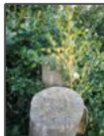
Arbres centenaires gravement mutilés