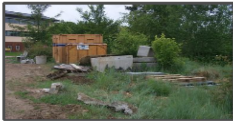
Dépôt de chantier dans le jardin écologique