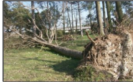
Dégâts lors de la tempête de 1999

Des richesses laissées à l'abandon et endommagées