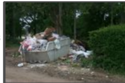
Benne à déchets dans l'arboretum