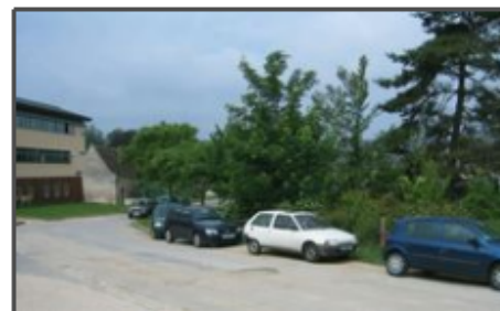
Envahissement par les voitures