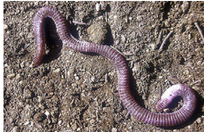
Individuo parcialmente albino. © José Martín.

Activo bajo piedras o a poca profundidad en el sustrato en primavera y verano, aunque en sitios cálidos puede estar activo desde febrero a noviembre. Diurno, puede estar activo de noche en verano. Mantiene su temperatura corporal óptima mediante movimientos dentro del sustrato y seleccionando rocas de grosores variables.