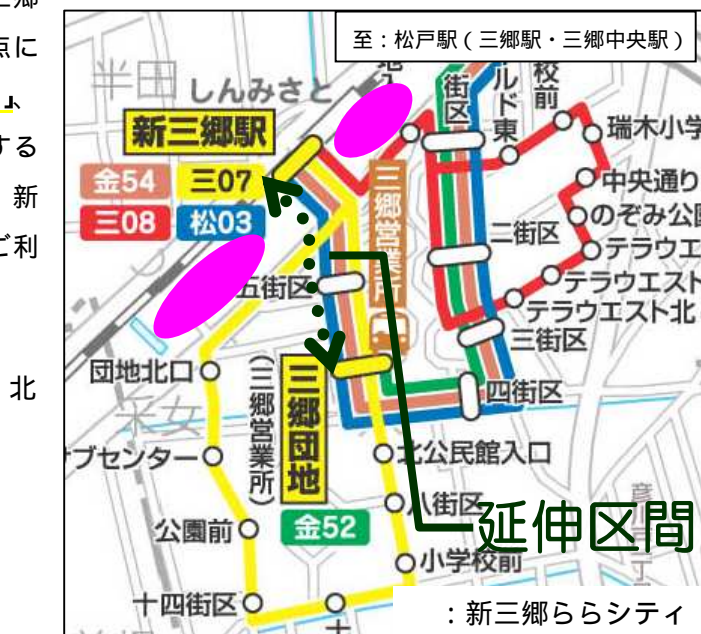
< 延伸区間（新三郷駅～三郷団地） >