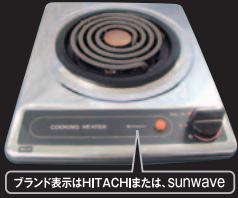
ブランド表示はHITACHIまたは、SUNWAVE 一口こんろ (上面操作)