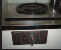
一口こんろ (前面操作)