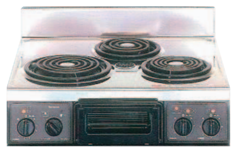
複数口こんろ (前面操作のみ)