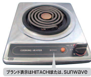
ブランド表示はHITACHIまたは、SUNWAVE