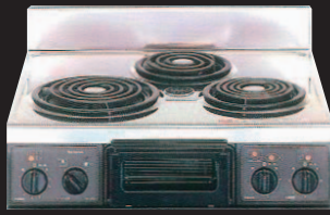
複数口こんろ (前面操作のみ)