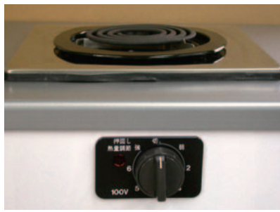
一口こんろ (前面操作) ※写真は富士工業製

身体や物が接触し、意図せずスイッチが「入」となる可能性がある構造であったために、電気こんろの上や周囲に可燃物が置かれていて、火災事故に至る危険性があります。