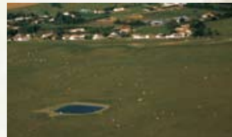
Village du forgeais sur la communal de Lairoux

□ Le communal de Lairoux contiguë à celui de Curzon s'étend le long du Lay. Le promontoire constitué par la presqu'île où se situe le village de Lairoux vous permet d'observer à perte de vue la vallée du Lay.