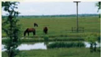
Plate forme à cigognes à Saint-Benoist-sur-Mer

□ Le communal de Chasnais , en bordure du Booth Bourdin, s'inscrit dans une vaste étendue de prairies humides. Vous pourrez vous imprégner de cette ambiance en empruntant la route entre Chasnais et Triaize.