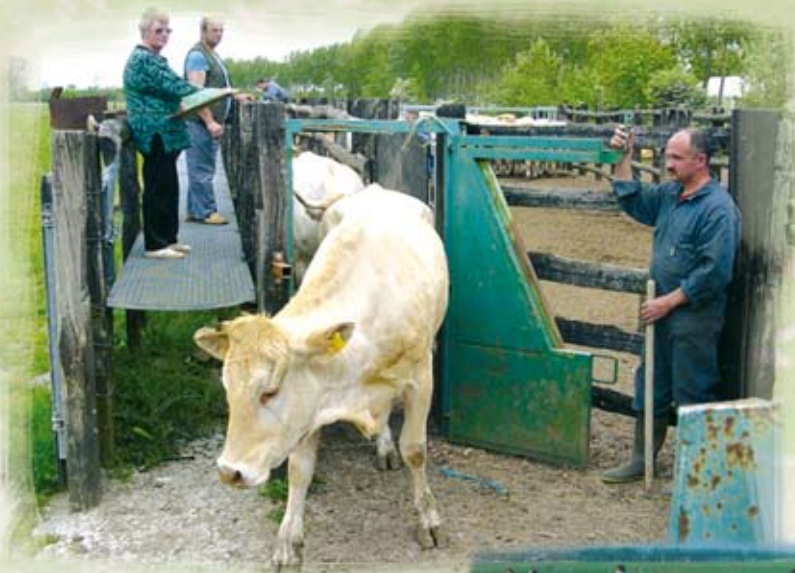
Les animaux regagnent les prairies communales