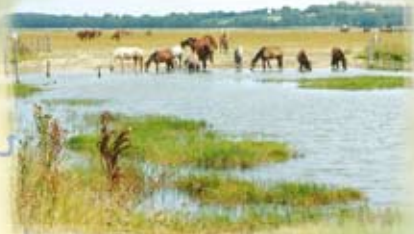
Les chevaux s'abreuvent à la mare