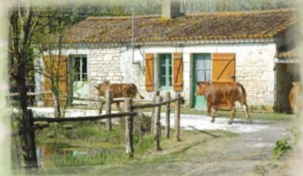
Jusque dans les années 60, les pâtres qui logeaient sur place d'avril à décembre, aidaient les éleveurs dans leurs tâches quotidiennes.