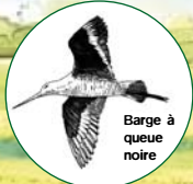
Barge à queue noire