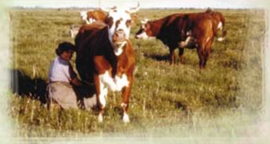
Traite d'une vache sur le communal de Nalliers

Passage obligé par le parc de contention pour les contrôles sanitaires