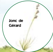
Jonc de Gérard