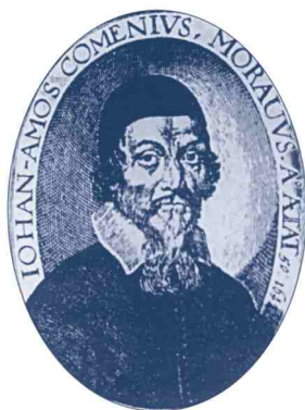
Comenius Johannes Amos (Jan Amos Komenský)