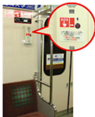
非常通報ボタン車内配置図

ひじょう つうほう 非常通報ボタン を 1車両に3カ所設置 しています(下図)。 このボタンを押すと、 運転手と直接通話 することができます。 ※運転手が応答できない場合 には、運行管理を行う職員が 応答します。