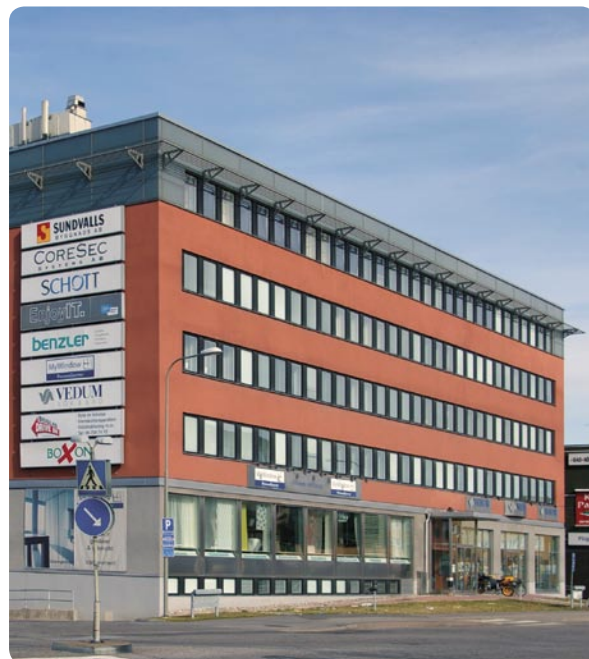
Sundvalls Byggnads AB har huvudkontor på Karlsbodavägen 9-11 i Bromma.