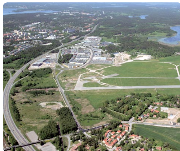
Barkarbystaden byggs på det tidigare flygfältet (Bergslagsbild AB).

Flottiljområdet II omfattar 250 lägenheter varav 50 stycken utgör äldreboende. Tre olika hus typer, atriumhus, radhus och flerbostadshus, i öppna kvarter kommer att gruppera sig runt ett gemensamt parkstråk. Inflyttning är planerad till senare delen av 2010. ■