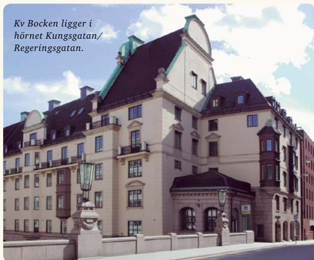
Kv Bocken ligger i hörnet Kungsgatan/ Regeringsgatan.