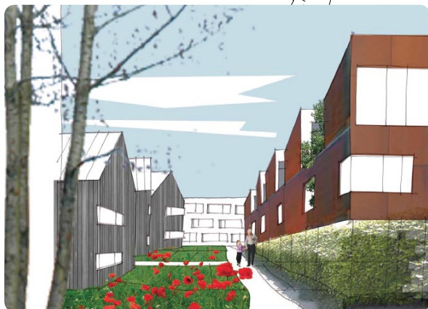
Perspektivbild – radhuslångor/atriumhus (GPP Arkitekter A/S).

Förverkligandet av planerna på att bebygga det tidigare flygfältsområdet i Barkarby är i full gång och Sundvalls finns med som en av byggherrarna.