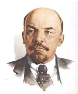
Vladimir Ilich Lenin mandatos a fin de controlar sus acciones.

la preparación para la toma del poder, la otra tendencia, liderada por Zinoviev y Kamenev, denunciaba la tentativa de Revolución Social como aventurerista y no iban más allá de llamar a la Asamblea Constituyente en la cual los Bolcheviques ocuparían los puestos más a la izquierda. El punto de vista de Lenin prevaleció y el Partido comenzó a movilizar sus fuerzas en caso de la lucha decisiva de las masas en contra del gobierno provisional.