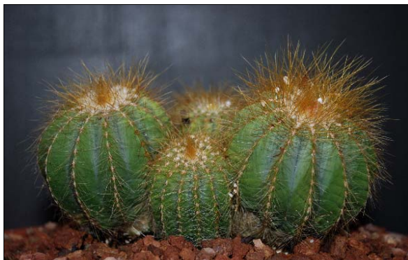
Grupo de parodias juvenes (unos 5 años)

Cultivar en substrato estándar (1/3 arena, 1/3 turba rubia y un 1/3 tierra) con buen drenaje, a semisombra cuando son jóvenes, pues se queman fácilmente por el sol, una vez adultas se pueden cultivar a pleno sol. Riegos invernar seca, con un mínimo de seguridad de 5 °C, aunque aguantan ligeras heladas (-7 °C) si están completamente secas, en verano regar cada 15 días.