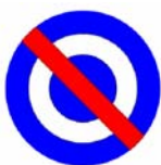
Escarapela identificada con La Bandera de los Treinta y Tres Orientales