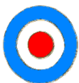
Escarapela identificada con la Bandera de Artigas