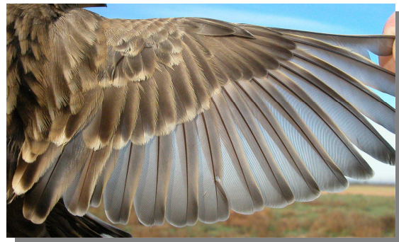
Gorrión chillón. Ala en invierno (01-XI)