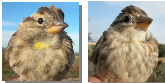
Gorrión chillón. Diseño del pecho: izquierda adulto (01-XI); derecha juvenil (18-VII).