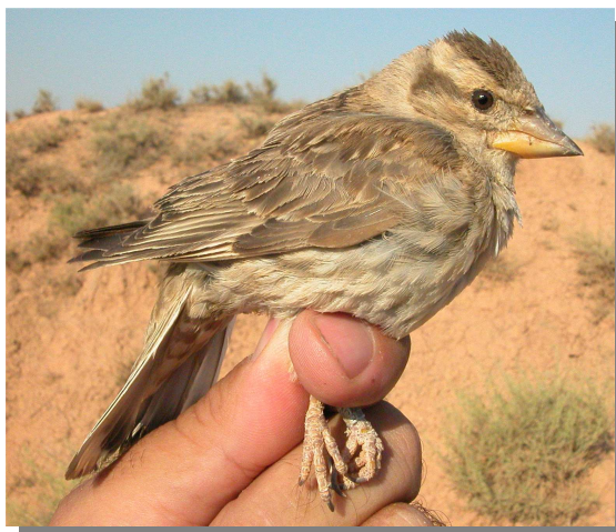
Gorrión chillón. Adulto en verano. 6 de julio.