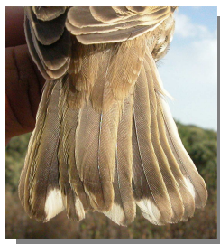
Gorrión chillón. Desgaste de la cola en verano: izquierda adulto (06-VII); derecha juvenil (18-07).