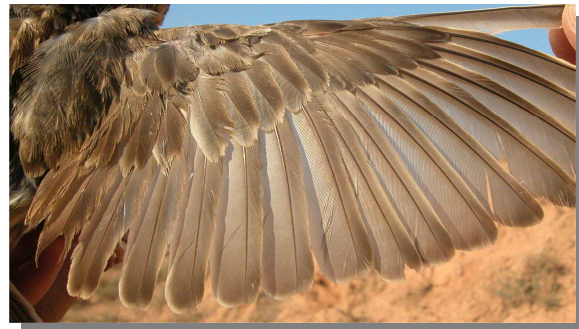
Gorrión chillón. Ala de adulto en verano (06-VII).