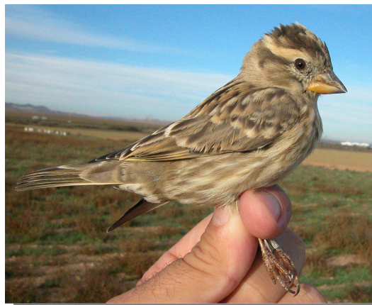
Gorrión chillón. Invierno (01-XI)

Sedentario. Repartido por toda la Comunidad faltando en las áreas más montañosas y zonas deforestadas de la Depresión del Ebro.