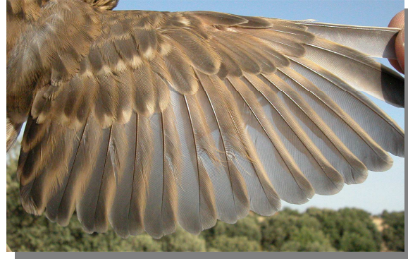
Gorrión chillón. Ala de juvenil (21-VII).

Gorrión chillón. Diseño de la cabeza y color del iris: arriba adulto (06-VII); abajo juvenil (18-VII).