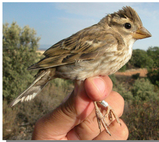
Gorrión chillón. Juvenil (18-VII).