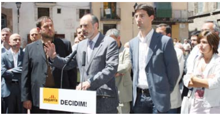
Junqueras, Ridao i Solé en roda de premsa al Fossar de les Moreres.