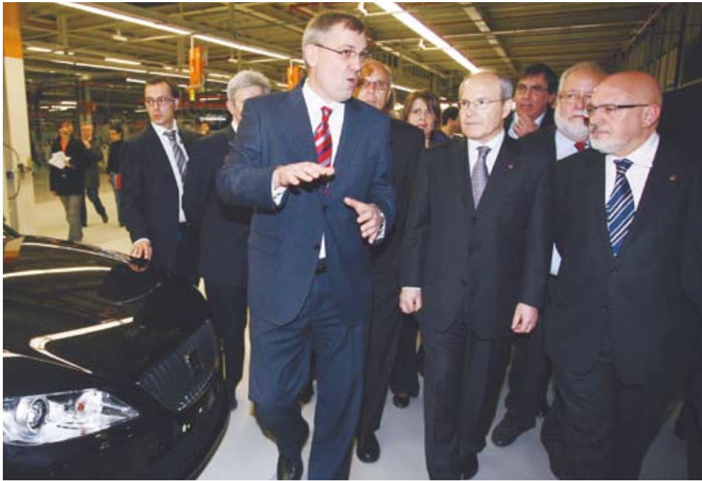
Montilla i Huguet van visitar la planta de SEAT a Martorell.