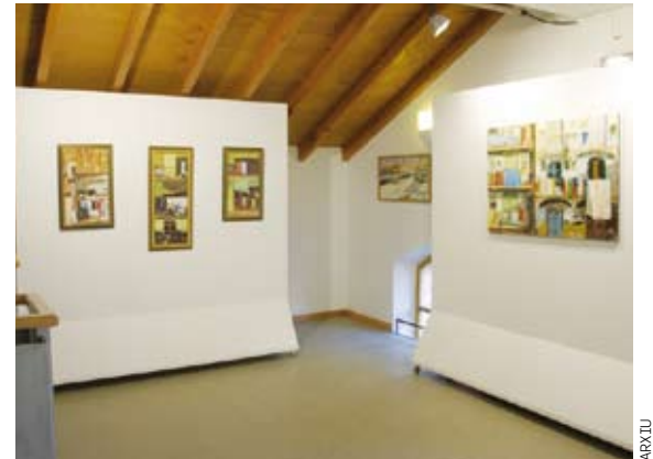
La Sala dPAS a l'Escorxador, a Vilafranca del Penedès.

Cal destacar, finalment, que seguint un criteri de racionalitat, el pla preveu la creació dels mapes locals d'equipaments, un instrument de planificació que ha de permetre ordenar-los de forma integrada. Pels ajuntaments, per tant, el Pla d'Equipaments Culturals es converteix en una bona eina d'ordenació, planificació i coordinació dels equipaments culturals existents i de nova creació.