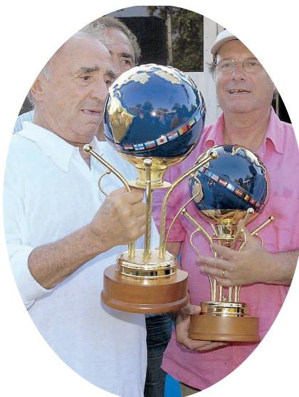
Trophée des Artistes Henri Salvador - France 3 - RTL