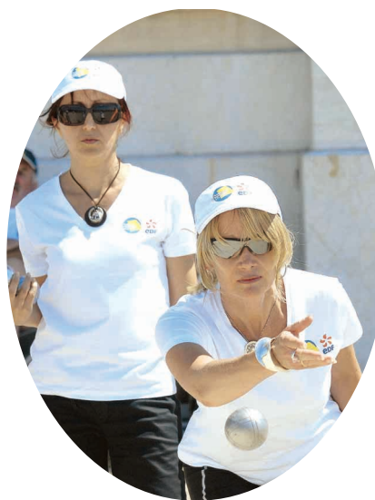
Grand Prix Féminin EDF - La Marseillaise