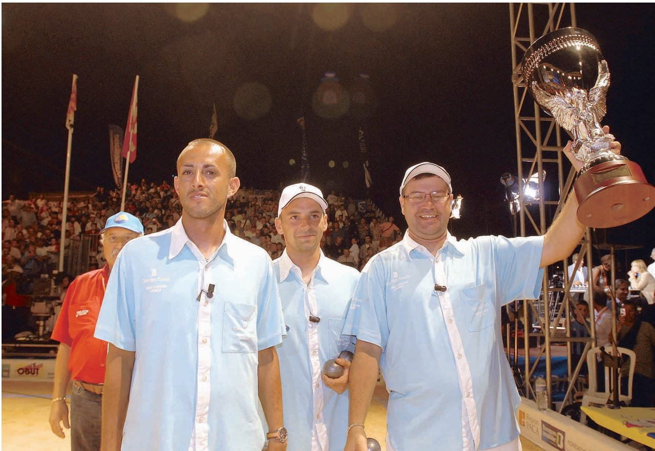
Mondial La Marseillaise à Pétanque