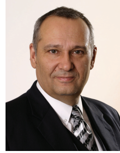
Pavel Rödl Mayor of Pilsen

أسسها ملك بوهيميا وينسيسلاس الثاني، في سنة 1295 عند ملتقى أربعة أنهار، وبيلسين اليوم هي المدينة الرابعة الأكبر في جمهورية التشيك يعيش أكثر من 163,000 شخص في منطقة تبلغ مساحتها دون 140 كيلومترا مربعا. إن موقع بيلسين المثالي الجغرافي بين مدينة براغ وألمانيا يجعلها مركزا طبيعيا للتجارة والثقافة والتعليم.