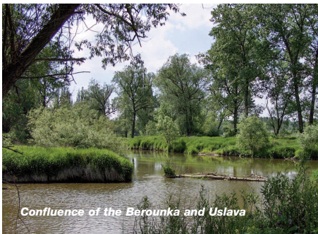
Confluence of the Berounka and Uslava

التخطيط للمستقبل: ويجب أن يثبت هذا القسم إستعمال الخطط الملائمة للتأكد من الإستدامة المستمرة للمشروع وتنميته. ويجب أن يبرهن هذا العرض كيف أن الخطة الشاملة على المدى الأطول تتضمن كل عنصر من عناصر المشروع.