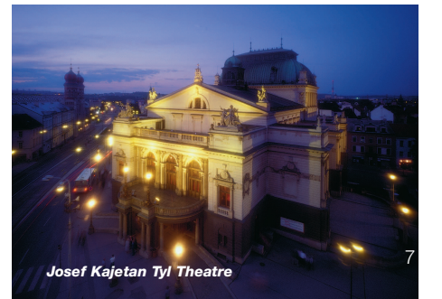
Josef Kajetan Tyl Theatre