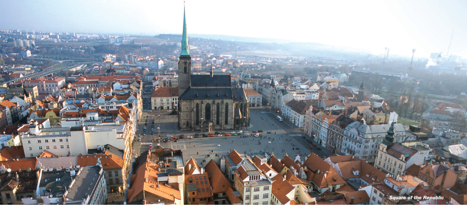
Square of the Republic