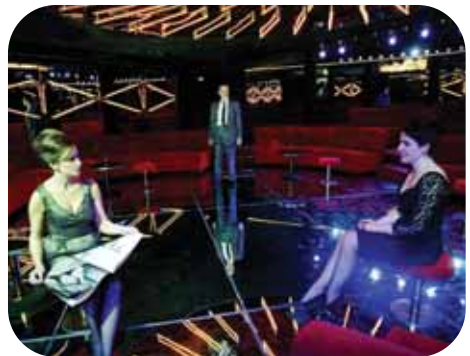
table y en constante movimiento, algo que no puede fijarse en el tiempo y en el espacio.

Formada por varias historias que protagonizan varios personajes que intentan saber quiénes son y quiénes son los demás. Sin embargo, ven cómo la sociedad les exige una identidad, ellos exigen a los demás una identidad, y nos la exigen a nosotros mismos, pero la experiencia nos demuestra que no existe la identidad, que la personalidad es algo mu-